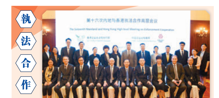
香港證監會與中國證監會近日舉行了第十六次定期高層執法合作會議。該會議在雲南省昆明市舉行，重點研討加強雙方合作的措施。雙方深入探討如何進一步加強兩地證券執法合作，以更有效打擊跨境證券違法違規行為，保護香港和內地投資者的合法權益，並鞏固香港作為國際金融中心的地位。 ◆香港文匯報記者 蔡競文

跟蹤的標的指數或其編制方案的南北向ETF，亦須符合以下任何一組條件。要求寬基（反映某個市場或某種規模股票表現指數）股票指數，單一成份股權重不超過30%；追蹤非寬基股票指數的北向ETF中，成份股不可低於30隻；若為非寬基股票指數的ETF，或者單一成份證券權重不超過15%，前五大成份證券權重合計佔比不超過60%，權重佔比合計90%以上的成份股最近1年日均成交金額，位於其所在交易所上市股票的前80%。