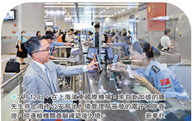
◆7月12日，在上海浦東國際機場，來自新加坡的鍾先生持上海市公安局出入境管理局簽發的電子回岸簽證，經邊檢機關查驗確認後入境。