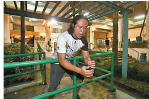
▲救人英雄陸先生以欄杆作窗台，示範當時緊抓老翁左腳阻止其下墜時的情形。