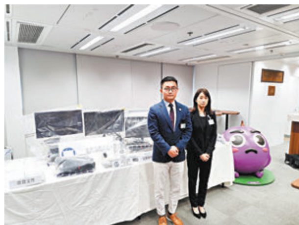
◆警方講述案情及展示檢獲證物。

灣仔警區重案組探員翻查多區閉路電視影片及情報分析，鎖定詐騙集團7名涉案男女身份及匿藏地點；由周三（10日）起一連兩日展開代號「煙河」行動，拘捕7名目標男女，並檢獲被捕人涉詐騙受害人所用電話、犯案時穿着衣服、收取騙款銀行卡，以及懷疑與案有關的名貴手袋和珠寶首飾等貴重財物，呼籲仍未報案市民盡快與調查人員聯絡。