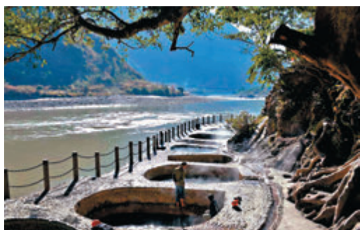
◆ 怒江登埂澡塘。

在登埂澡塘，有一個古老的傳說。相傳古時登埂河邊有兩位一母同胞的僮僕族姐妹，姐姐名叫阿芝，妹妹叫阿麻。姐妹倆從小父母雙亡，靠自己靈巧的雙手織花布維持生計。姐妹倆不但手巧，人也長得美，唱起歌來連森林中的小鳥也會停駐枝頭傾聽。村寨的頭人看中了姐妹倆，可是姐妹倆不願嫁給頭人。頭人惱羞成怒，把姐妹倆關起來，威逼利誘，甚至嚴刑拷打。頭人的僕人同情兩姐妹，悄悄地幫她們放出了牢房。阿芝和阿麻姐妹倆被迫逃入深山老林，靠吃野果活命。狠毒的頭人還是不放過她們，派許多部下上山搜捕。兩姐妹被發現後走投無路，雙雙縱身跳下了懸崖。姐妹倆死後，身軀化成了高黎貢山的山脈，身軀墜落的地方湧出了汩汩的溫泉。當地人認為這些溫泉