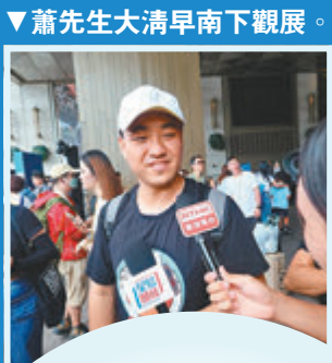
▼蕭先生大清早南下觀展。