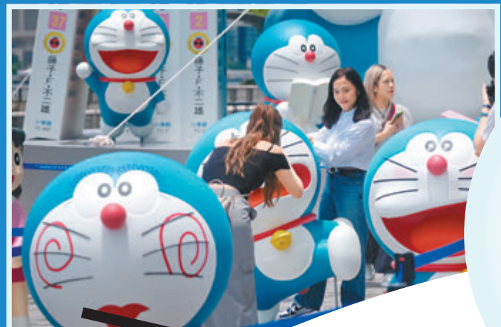
◆現場展出各種造型的多啦A夢。