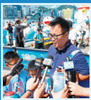
▲陳先生從美國舉家回港。