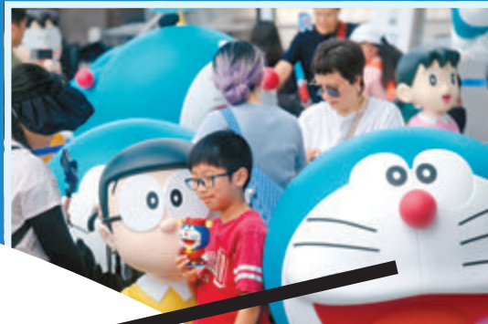
◆大小朋友開心打卡。