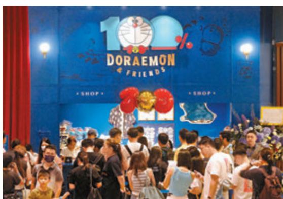
◆全球多啦A夢「鐵粉」進場搶購周邊產品。

入場觀展亦是不少旅行團的打行程，其中一團來自菲律賓。團員們在免費展區欣賞多啦A夢雕塑，以及到星光大道打卡。團員們均表示，自小觀看多啦A夢卡通片長大，因此感到非常興奮，形容看到12米高的大型充氣多啦A夢，以及與多隻不同造型的多啦A夢合照是「Dreams come true」。有團友透露，已兌換1.5萬港元來港購物。