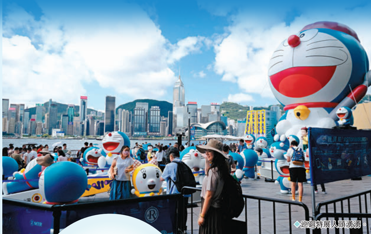
◆巡迴特展人頭湧湧。