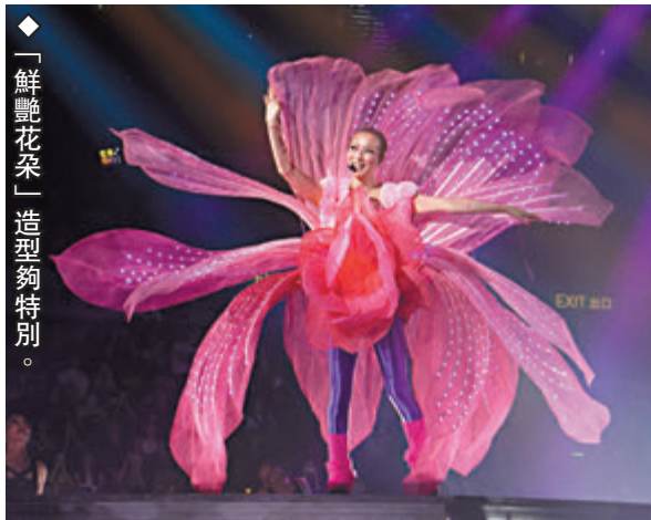
「鮮艷花朵」造型夠特別。

香港文匯報訊（記者子棠）鄭秀文（Sammi）前晚舉行的首場《You & Mi世界巡迴演唱會香港站2023》驚喜連場，誠如Sammi所言，為了感謝歌迷等候一年，要加倍用心「雙倍回報」，她起用了多達13個不同造型，演唱38首曲目，為歌迷帶來極盡視聽享受的演出。最令人意想不到的是老公許志安擔任表演嘉賓，為Sammi伴奏兼合唱，二人相隔10多年再度在紅館合體、遙望對唱，打造了另類的「放閃」，成為全晚的超級彩蛋！