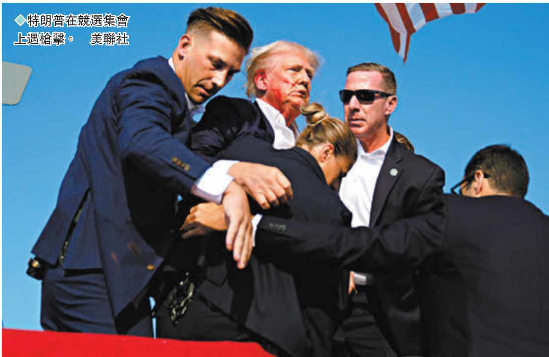
◆特朗普在競選集會上遇槍擊。