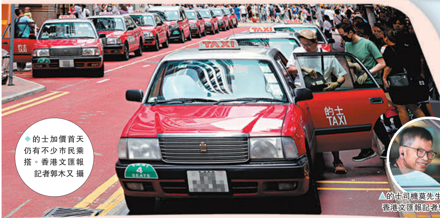
◆的士加價首天仍有不少市民乘搭。