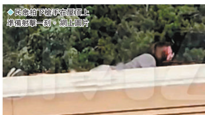
民眾拍下槍手在屋頂上準備射擊一刻。

據報之後終於有特勤局探員注意到格雷格，但現場隨即傳出槍聲，然後特朗普倒下，現場一片混亂，其後就是特勤局人員喊道「槍手已被擊倒」。