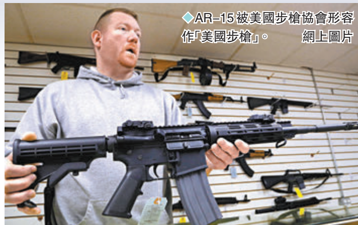
AR-15被美國步槍協會形容作「美國步槍」。網上圖片

美國於1994年簽署聯邦攻擊性武器禁令，封殺包括AR-15步槍在內的多種武器，為期10年。但禁令到期後未獲延長，於2004年自動失效，令該款槍械重新流入市場。美國現時有9個州禁止銷售或持有AR-15步槍。賓夕法尼亞州允許18歲以上人士合法持有步槍，合法持有手槍則需年滿21歲。