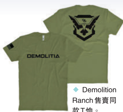
Demolition Ranch 售賣同款T恤。網上圖片

Demolition Ranch頻道主持人卡里克在社媒Instagram(Ig)擁有154萬粉絲，事發後關於槍手T恤來源的猜測在社媒廣傳，卡里克在Ig發文，配上克魯克斯倒臥屋頂的相片，並寫道「到底是怎麼回事」。