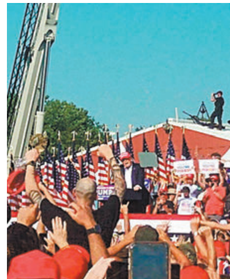
事發前影片顯示，特勤局人員在特朗普講台附近的屋頂進行監視。

香港文匯報訊 槍手能在聯邦和地方執法部門保護的競選集會上，向前總統特朗普開槍，引發外界關注保安工作是否出現漏洞。安全專家表示，要消除所有威脅是困難甚至基本上是不可能，尤其屬於戶外活動及槍手使用遠程武器，但有專家認為，常規預防措施應防止槍手爬上附近屋頂。加州前特警指揮官諾丁漢更指今次槍擊事件是「根本性的保安失敗」。眾議院監督委員會已傳召特勤局局長切特爾本月22日到國會作供，檢討保安安排。