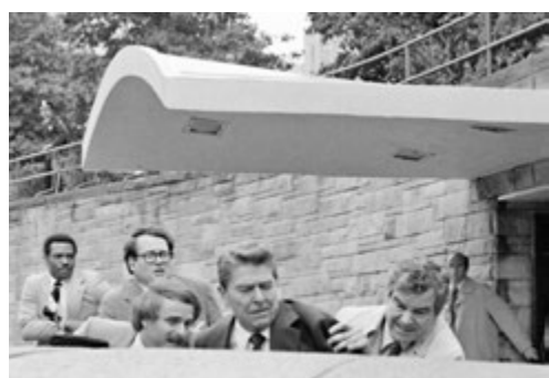
◆ 里根於1981年3月底在華盛頓一間酒店外演講後遭槍擊。

香港文匯報訊 美國史上多次發生針對總統或總統參選人的暗殺意圖，其中4人身亡，上一次行刺案發生於1981年，時任共和黨籍總統里根被槍擊受傷。