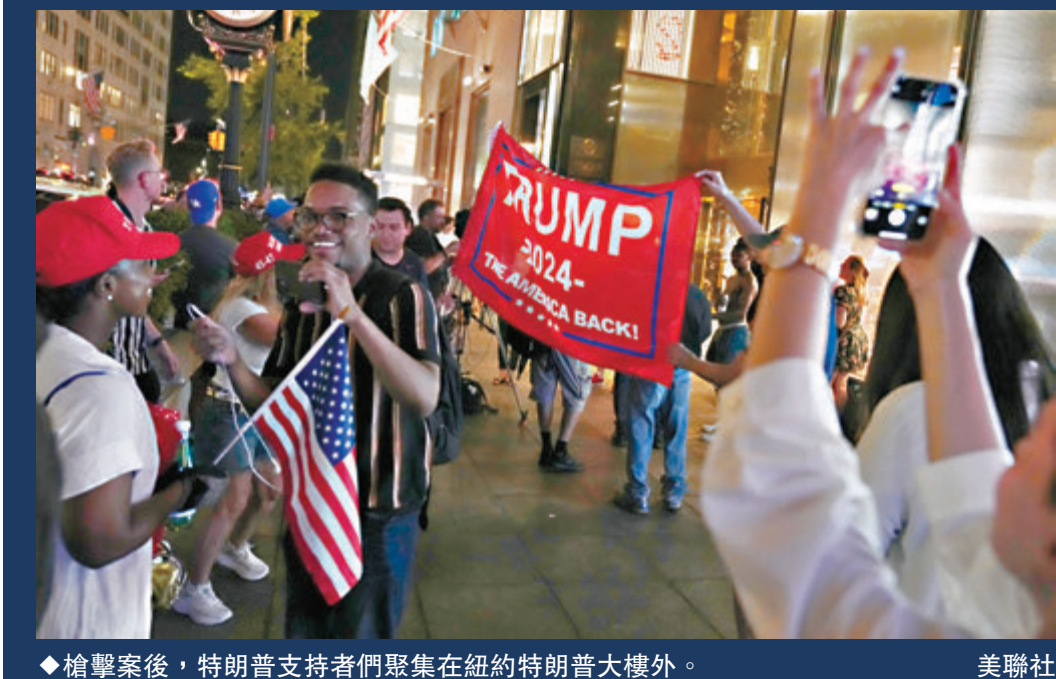
◆ 槍擊案後，特朗普支持者們聚集在紐約特朗普大樓外。