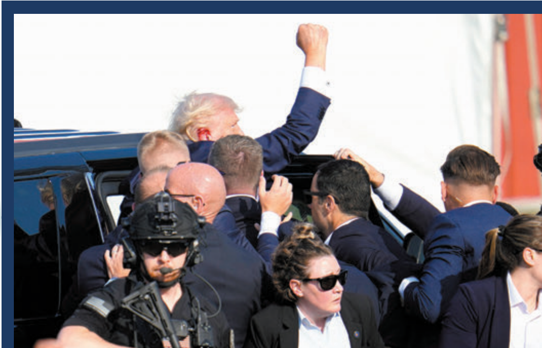
◆ 特朗普在遭受槍擊後攙扶離場時振臂高呼。

得州萊斯大學總統歷史學家布林克利表示，特朗普的揮拳形象極具標誌性，「在美式精神中，人們喜歡看到壓力下的堅韌和勇氣，特朗普高舉拳頭的形象將成為新的象徵：在一次企圖暗殺中倖存，你就成為了「烈士」，因為你得到了公眾的同情。」 英媒《金融時報》指出，遇刺事件將強化保守派陣營對特朗普的認同。多名共和黨人在事發後，紛紛在社媒轉載特朗普揮拳的相片。知名極右共和黨參議員盧比奧直呼，「是上帝保護了特朗普」。俄亥俄州共和黨參議員麥克·李更呼籲總統拜登，立即頒令撤銷對「特朗普總統」的所有刑事指控。特朗普的大批政治盟友也在槍手身份及動機均未查清時，便將槍擊事件歸咎民主黨對手甚至拜登本人。