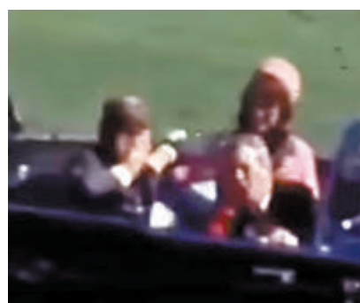
◆ 1963年，肯尼迪在車隊駛過達拉斯市中心迪利廣場時遭人開槍後宣告不治。 資料圖片