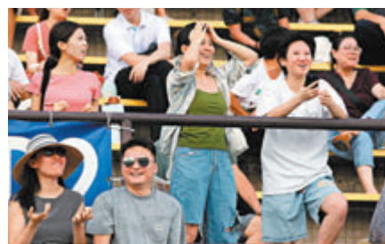
◆部分馬迷看得非常肉緊。