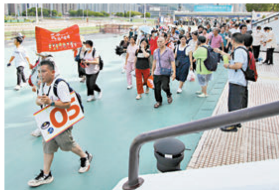
◆有旅行團帶團友參觀賽馬體驗氣氛。