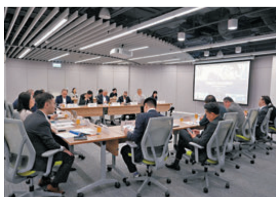
◆特首政策組舉行香港新型工業化路徑探索內部研討會。受訪者供圖

據了解，會上多名專家討論並認同香港擁有多項優勢，符合內地有意來港發展企業的需求和期望。他們提到，首先香港是理想的融資平台，在香港的資金可自由流動，與境外企業合作時，匯款和融資的手續和程序較簡單便利，且有多種融資渠道，包括風險投資基金；第二，香港是理想的研發平台，香港設有如科學園等多個創科孵化平台，企業希望透過來港進行研發，加強與本港高校的合作，吸引全球研發的人才，深化技