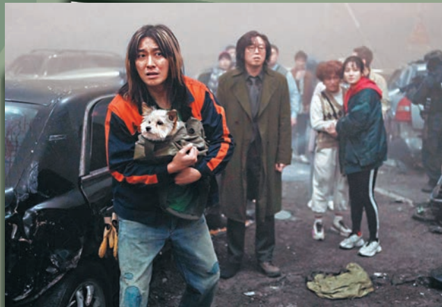
一場異獸追擊戰一觸即發！

電影中另一主角、2006年模特兒出身的朱智勛，自《與神同行》系列一舉成名，2015年憑着《黑仔型警》奪得當年「百想藝術大賞」的最佳男主角，近年一直挑戰不同種類的電影和劇集，包括《北韓諜戰》(2018年)《屍戰朝鮮》第一、二季(2019年及2020年)，李政宰監製兼執導《獵戰》(2022年)及河正宇合演的《救參的士》(2023年)等；今次朱智勛挑戰一個嶄新的角色——一個四處奔波的拖車司機，總是渴望找到一個能改變他生活的轉機。在加油站打工時，與青瓦台國安局主任發生了爭執因而結怨。後來機場大橋發生交通意外，他帶著寵物狗Jodie一起去到大橋拖走損壞的車輛，卻因此陷入無法脫身的險境中。