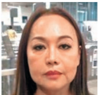
◆56歲女子疑用山埃毒殺其餘5人。

警方向死者家屬查問後，認為行兇動機或出於金錢糾紛，稱當中一對夫婦借錢給另一人，投資日本一個醫院建設項目，結果損失1,000萬泰銖（約217萬港元），債主夫婦對投資失誤感到不滿。