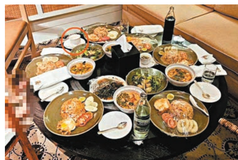
◆6人在房裏點了食物和茶。網上圖片