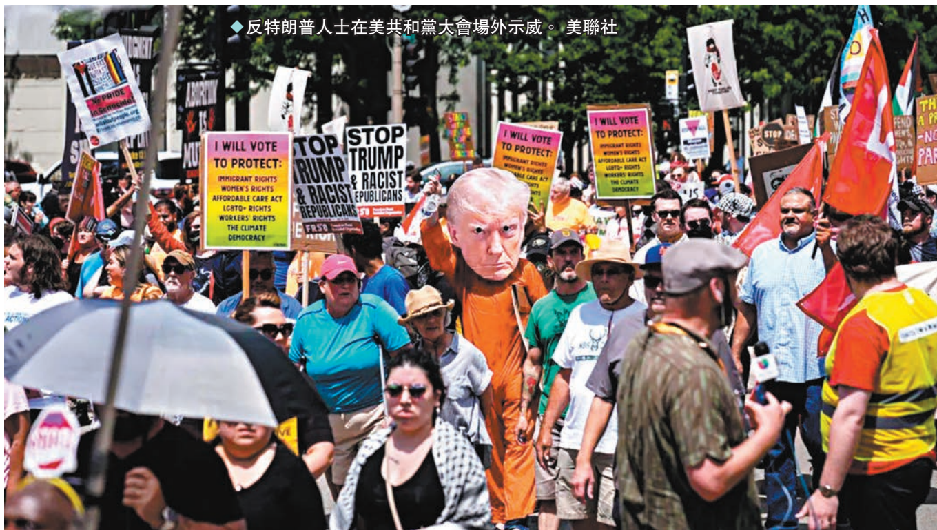
◆反特朗普人士在美共和黨大會場外示威。

最新民調中，跨黨派的多數受訪者均表示，他們擔心美國人會訴諸暴力，而非團結和平地解決分歧。行刺特朗普事件佔據媒體焦點，推升了保守派基督教支持者之間將特朗普視為「天選之人」的討論聲浪，65%已登記共和黨人認為，特朗普避過一劫，顯示他「受到天意青睞或神的眷顧」，僅11%民主黨人同意這個看法。