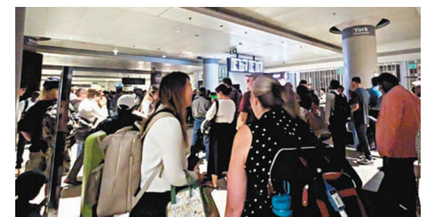
◆聯合車站擠滿等候火車的乘客。