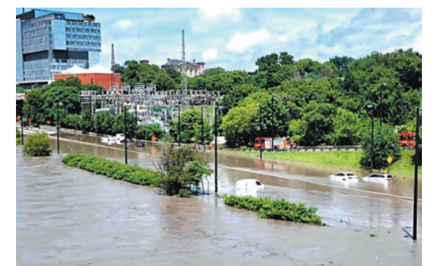
◆當河谷公路水浸成河，大量汽車拋錨。