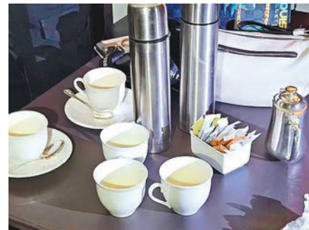
◆警員在6個茶杯發現山埃痕跡。網上圖片