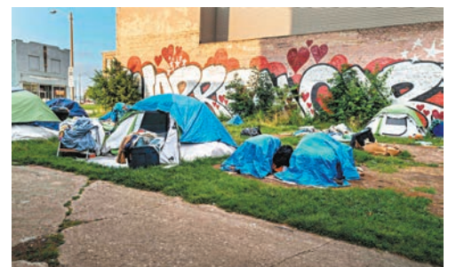
◆有無家者在會場附近紮營。

密爾沃基警方表示，開槍的警察來自俄亥俄州，屬於合共4,500名全美各地警察組成的大會安保特遣隊。當時有13名俄亥俄州警察在會場附近巡邏，其中5人開槍。