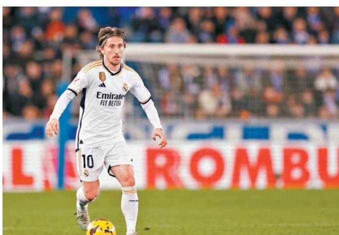
▲莫迪歷續寫傳奇。資料圖片

傳奇再續！西甲球會皇家馬德里昨日宣布，已同陣中的中場大師莫迪歷續約1年到2025年，這位克羅地亞的38歲老將揚言只要自己能夠踢下去，一定會繼續在球場上馳騁。