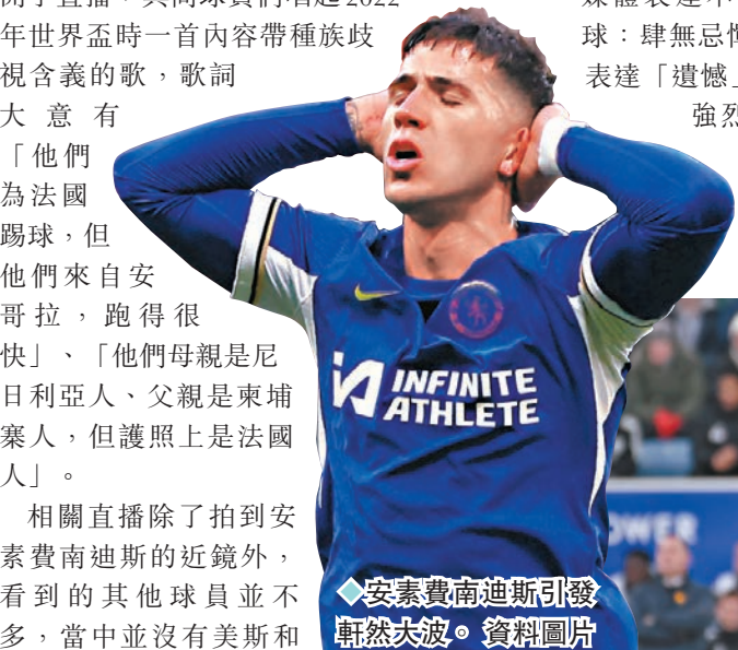
▲安素費南迪斯引發軒然大波。資料圖片

迪馬利亞的身影，安素費南迪斯被視為始作俑者。事後他的社群賬號被10名同樣效力車路士的法國人或黑人球員隊友取消了追蹤，包括韋斯利科芬拿、尼千古、迪沙斯和巴迪亞舒尼等。韋斯利科芬拿在社交媒體表達不滿，回應道：「2024年的足球：肆無忌憚的種族主義」，並加上數個表達「遺憾」的掩面表情圖案。法國足總強烈譴責事件，並會向阿根廷方面和國際足協提出抗議。據報車路士也會內部調查事件，安素費南迪斯有可能被罰停賽。」