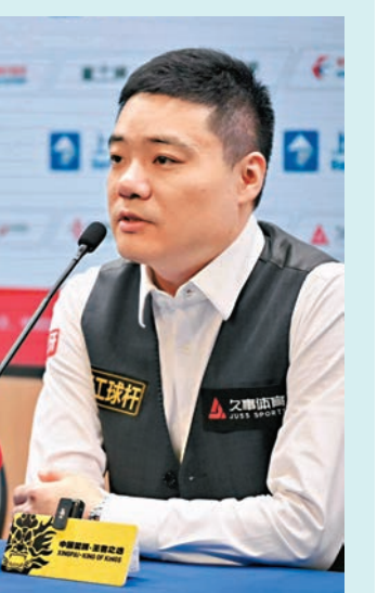
▲丁俊暉首場比賽戰至深夜，險勝晉級。

成功晉級8強，第35次「丁奧會」也將在本屆上海大師賽上演，這也是兩人為數不多的在中國交手的機會。丁俊暉對於2009年在上海大師賽與奧蘇利雲的交手印象深刻，「我還記得那場比賽，自己也盡力了，畢竟那會兒他還是狀態非常穩定的。」談及下一場對陣奧蘇利雲，丁俊暉對於自己能否保持穩定並不確定，不過在他看來「奧蘇利雲其實這些年也不是很穩定，但對於他這個級別的球員來說，比其他球員都要好很多，所以肯定難打，總之就是自己打好自己這方面，做好自己的攻防，去專注打就可以了。」