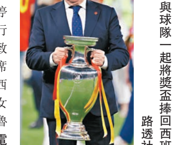
▲洛查剛與球隊一起將獎盃捧回西班牙。

育行政法庭(TAD)對洛查實施停職處分。法新社稱，西班牙體育行政法庭祭出的處分，現在可能導致洛查無法參加9月的下任足總主席選舉。洛查今年4月才被任命為西班牙足總主席，接任去年因強吻女足球員風波而被迫辭職的前主席魯比亞里斯。