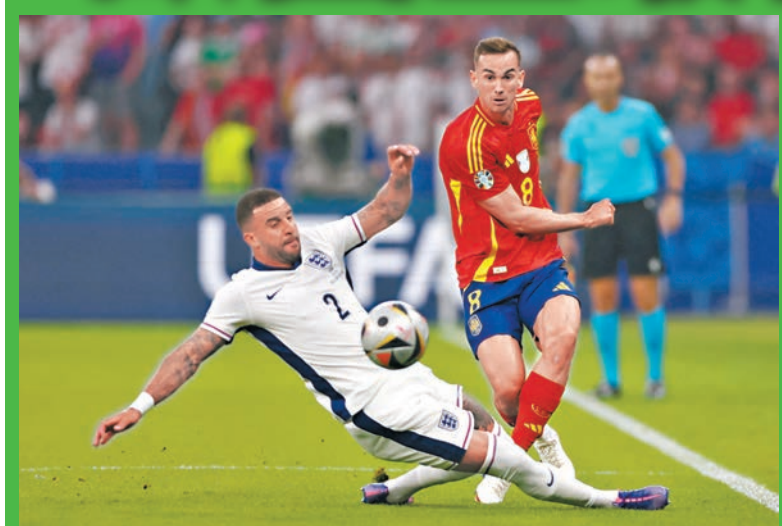
▲基爾獲加(左)在決賽曾與法比安彭拿過招。

歐洲足協官方公布了本屆歐洲國家盃的最佳11人陣容，陣容為433陣式，冠軍西班牙隊有6名球員入選，成為最佳陣容大贏家，屈居亞軍的英格蘭隊只有1人上榜，與德國隊及瑞士隊入圍人數一樣，而最佳陣容中4強止步的法國隊反而比英格蘭隊多1人。