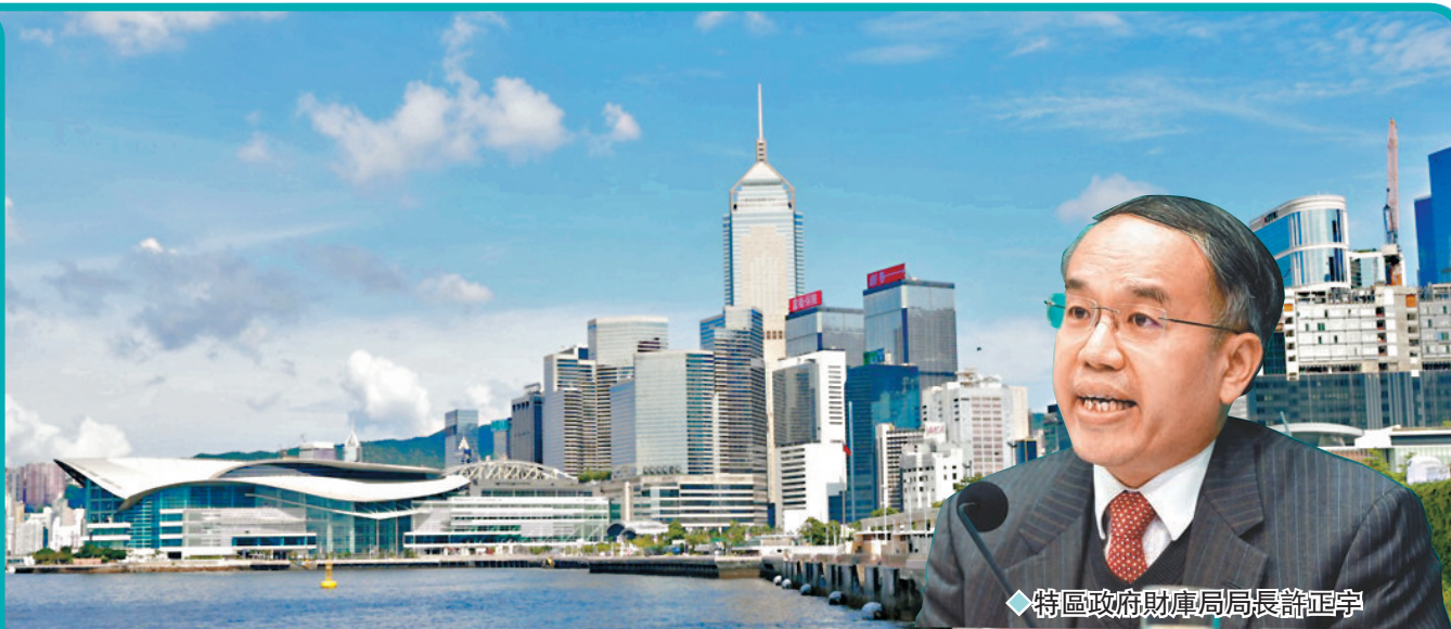
◆特區政府財庫局局長許正宇

許正宇認為，以上措施旨在鼓勵更多企業利用香港的綠色金融平台，推動可持續發展。他相信通過政府、監管機構、金融機構和企業共同努力，香港定能鞏固其作為亞洲領先綠色金融中心的地位。