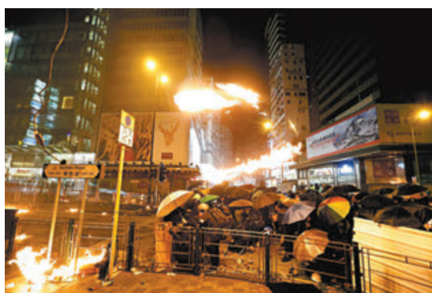
◆2019年11月18日，暴徒在油麻地一帶縱火堵路大肆破壞。