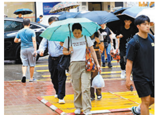
◆天文台考慮在今日下午至晚上發出一號戒備信號。

香港文匯報訊（記者 蕭景源）按照天文台預測，位於南海中部的熱帶低氣壓，預料向西北偏西移動，或會進入香港800公里範圍內，但其路徑及強度仍存在相當變數，與其相關的狂風驟雨及雷暴，會在下周初影響廣東沿岸。香港天文台將會視乎其動向，考慮在今日（20日）下午至晚上發出一號戒備信號。受其影響，星期日及星期一珠江口一帶將有狂風驟雨，離岸及高地風勢頗大。海有湧浪。市民請留意最新天氣預測。