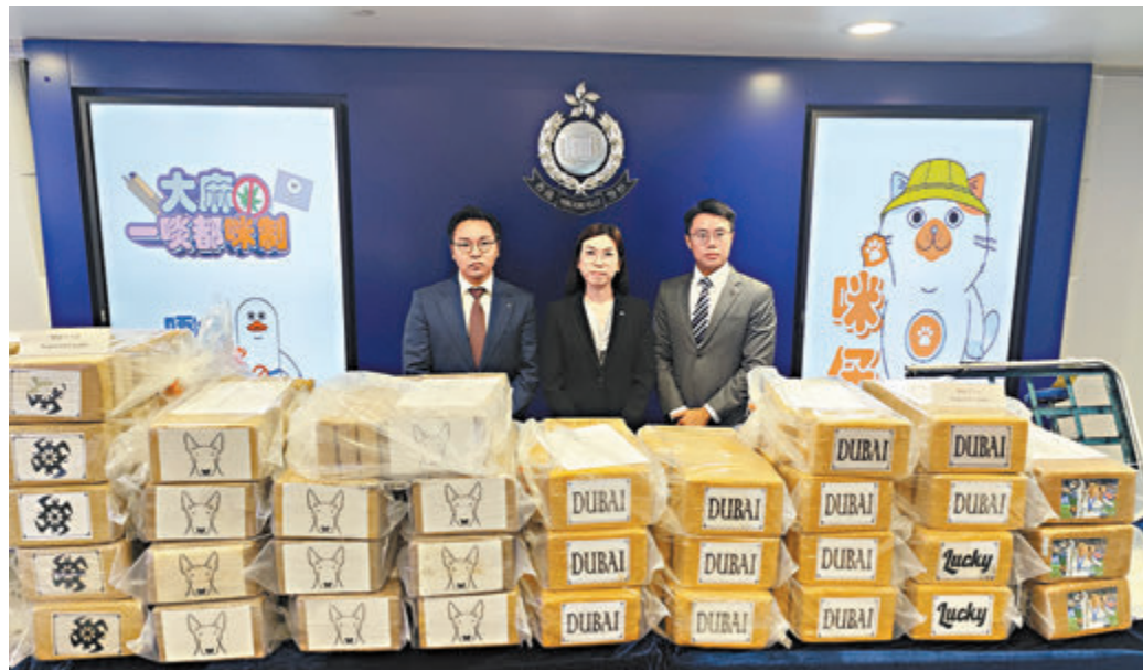
◆警方講述破獲今年最大宗可卡因案件詳情及展示分5種包裝可卡因磚等證物。