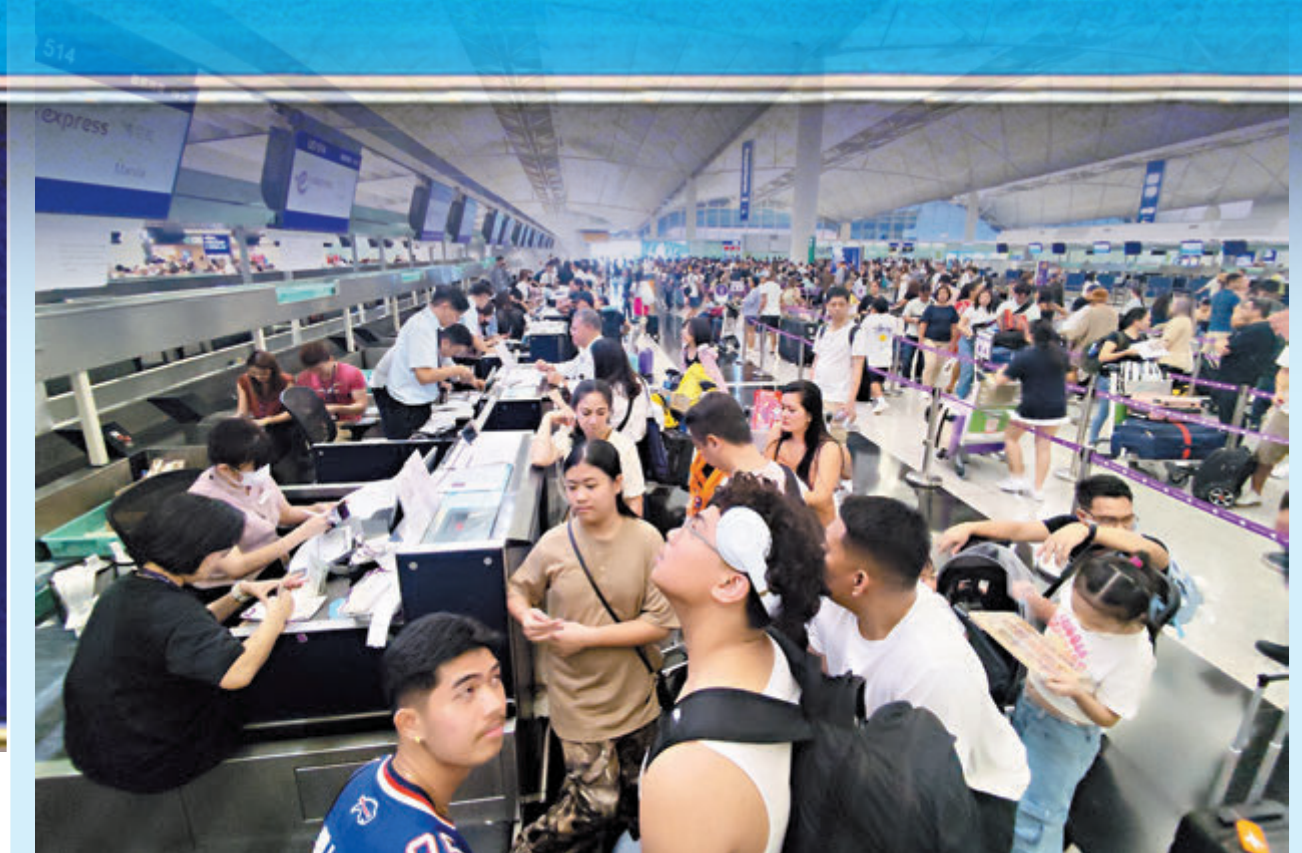
機場一度須改為人手辦理登機，櫃位附近的人龍看不到盡頭。