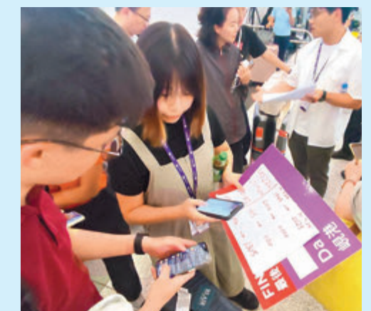
大批乘客在大堂等候。