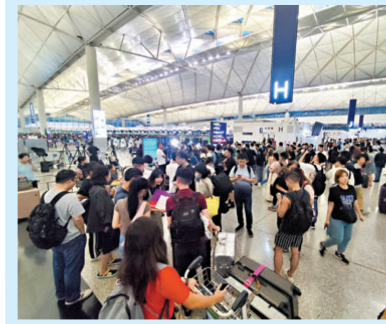
乘客在查詢航班變動情況。