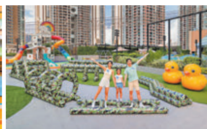
▲戶外親子充氣障礙賽