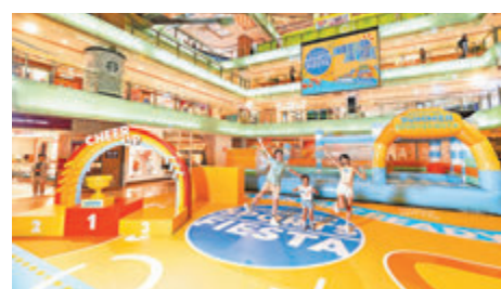
▲「輕功水上飄競技樂園」繽紛充氣裝置