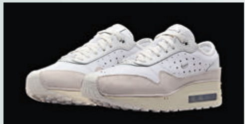
▲Nike x Jacquemus Air Max 1

今次夏季聯乘系列透過紅、白、藍、銀的配色，致敬了Jacquemus的法國起源，全新聯乘系列將包括10款彰顯不同生活方式的時尚單品，比如重新設計的運動服裝、T-shirt、運動內衣和長款半身裙等。第三款聯乘鞋款Nike x Jacquemus Air Max 1——結合了Nike經典Air氣墊飽滿、立體的輪廓，以及Jacquemus輕鬆寫意的標誌性風格，還有當前具有品牌標誌性的Le Swoosh——以Nike Swoosh標誌為靈感設計的時尚袋款，並推出了三款全新配色。