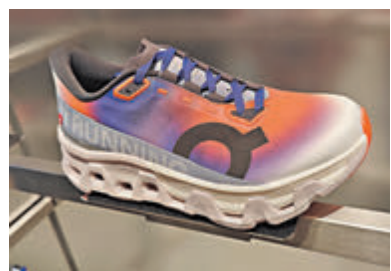
◆全球限量發售的Prism系列

延續Prism系列的美學靈感，品牌同步推出全新一代Cloudmonster Hyper長距離訓練跑鞋，為精英跑者日常訓練量身打造，全球限定配色，採用全馬競速跑鞋同款的Helion hyperfoam泡棉，配合持續優化的CloudTec科技等，實現強勁能量反饋和強效緩震。而微纖維梭織網眼面材質加以矽膠鞋帶設計，具備更好的透氣性和排汗性，將科技與時尚結合，為跑者們打造不一樣的跑步體驗。此外，香港同步首發Prism系列服飾CORE LONG-T、PERFORMANCE TANK，以及RUNNING SHORTS等。