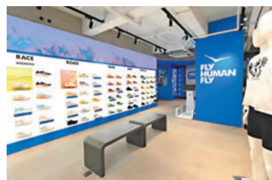
▲香港首間概念店設3D足測機

運動品牌HOKA首間概念店亦登陸銅鑼灣，店內亮點之一是獨有專業先進科技——3D腳型掃描技術SafeSize 3D足測機，這項創新科技能幫助顧客更精準地配對適合的品牌鞋款及尺碼，因應跑者們不同的跑步風格和偏好以滿足每個人的獨特需求。同時，品牌將最新最流行的鞋款系列引入香港市場，包括全新產品SkyFlow及人氣款式Speedgoat 6。