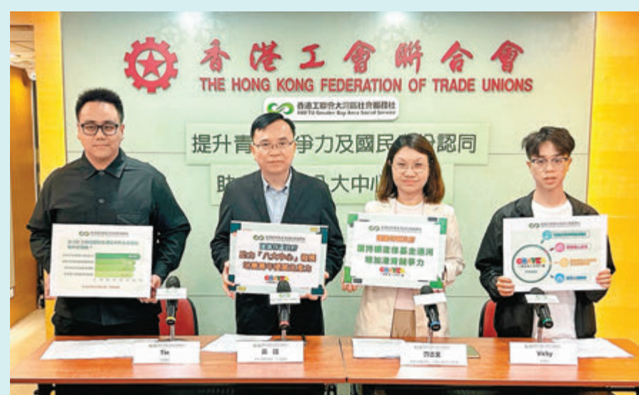
◆工聯會調查發現，92%參加「大灣區青年就業計劃」的參加者，已適應內地職場文化或工作氛圍。

工聯會其他建議包括強化政務的服務支援，並允許使用本港持續進修基金，協助灣區港青工餘時進修增值，並與內地探討為更多行業設灣區職業認證考試和推動更多專業在大灣區免試執業，以及為港青提供就業輔導。