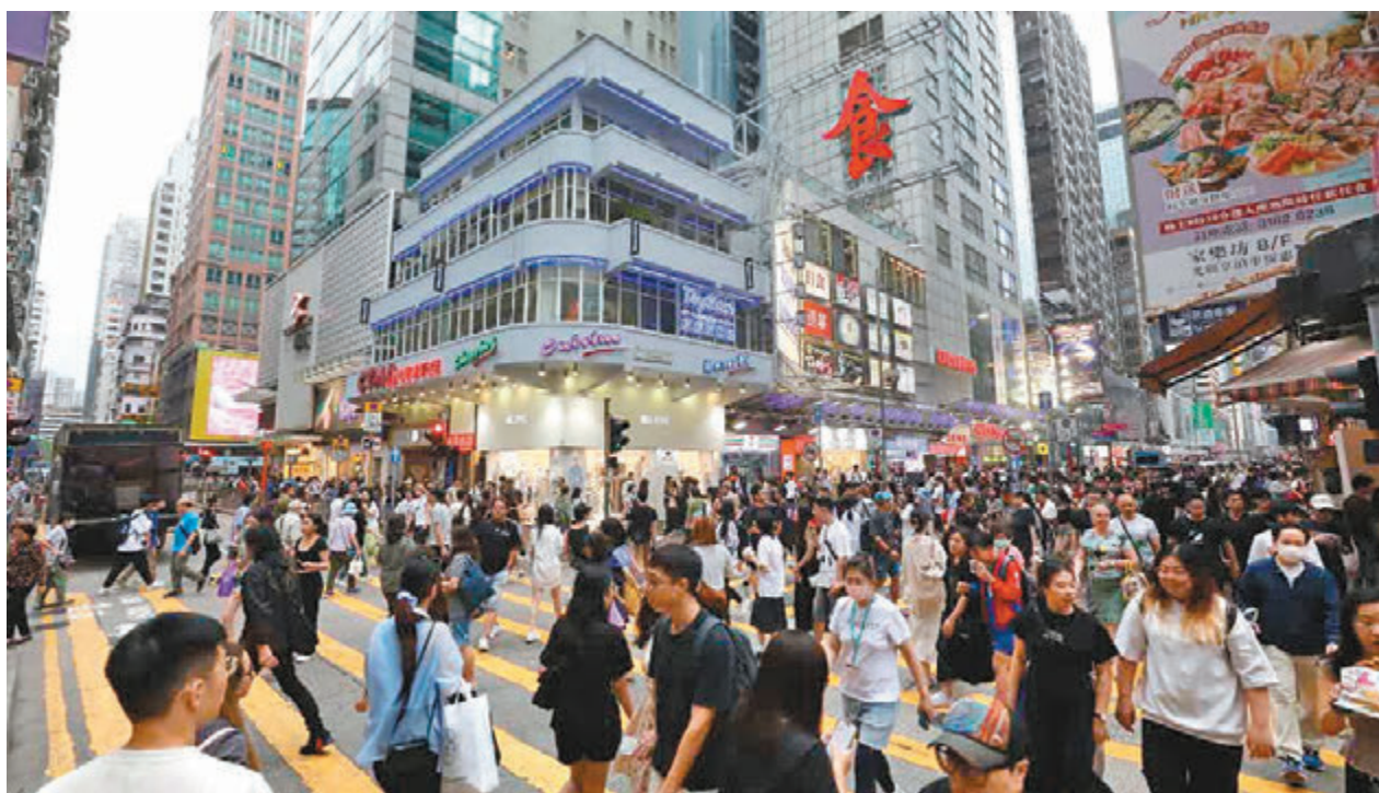
◆紫荊研究院調查結果反映，香港市民普遍歡迎和支持中央政府今年以來推出的各項挺港、惠港政策。資料圖片

紫荊研究院認為，是次調查結果反映香港市民普遍歡迎和支持中央政府今年以來推出的各項挺港、惠港政策，認為在中央政府強而有力的支持下，對香港經濟發展前景充滿信心。