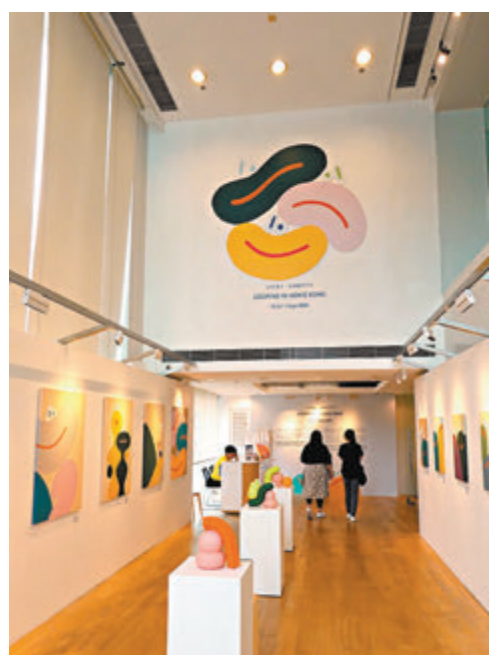
◆展覽展出藝術家的雕塑、畫作、動力裝置等不同媒介作品。

適逢暑假，海港城亦將 Lucas Zanotto 創作的角色實體化，在戶外設置巨型藝術互動裝置，為觀眾打造出充滿明媚色彩的多巴胺樂園。遠從天星碼頭，就可以望見 Lucas Zanotto 設計的經典大眼睛角色，展覽將之放大至 5 米高，充滿視覺震撼。運動樂園中，包括兩個打卡位、3 個運動主題活動區，小朋友可以沿着圓形單車徑踏單車沉浸式體驗，將藝術家的循環動畫實現化。