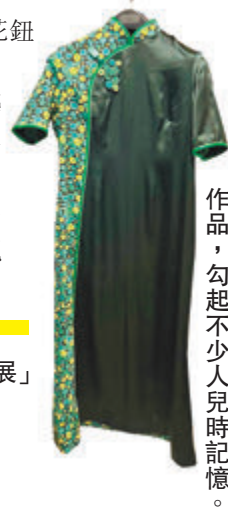
◆以懷舊彩絲糖為主題的花鈕作品，勾起不少人兒時記憶。

展覽：「花鈕工藝傳承師聯展」 展期：即日起至 7 月 25 日 地點：香港大會堂高座 7 樓展覽館