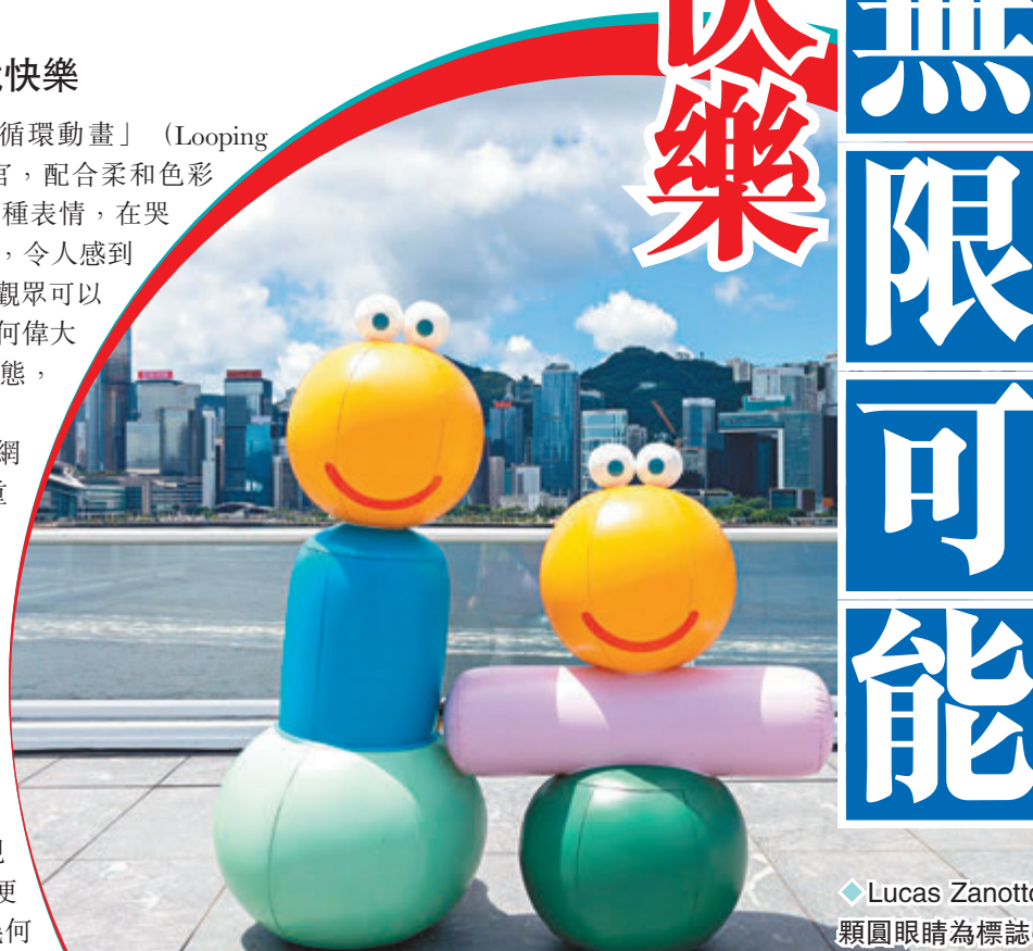
◆Lucas Zanotto 的設計以兩顆圓眼睛為標誌。

藝術家似乎以極簡的方式繪出了標誌性的兩顆滾圓眼睛，但無礙任何表情的轉換，和角色身體的多變。看似簡單的風格，卻產生奇妙的反應。這一切是如何發生的呢？藝術家提及他也是在偶然間發現不管是什麼形狀的物體，只要有了眼睛，便讓人感覺有了靈魂。於是嘗試為不同幾何形狀加上眼睛、嘴巴，在簡單的形狀中尋找各