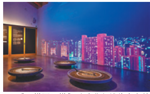
▲《一樣不一樣》以香港和越後妻有的不同為靈感。

展覽亦利用了投影和燈光效果在牆壁上打造動態天空景象，隨著時間流動變化，反映著城市生活的快速步伐。手造的泥盤象徵農人與四季之間的持久聯繫，機械裝置令農具在泥盤上轉動，旋轉速度跟時針一樣，帶出城市人生活像跟隨機械時鐘一樣，而農民則跟隨大自然時鐘，展現出兩地人對時間不同的感知。藝術家透過作品向當