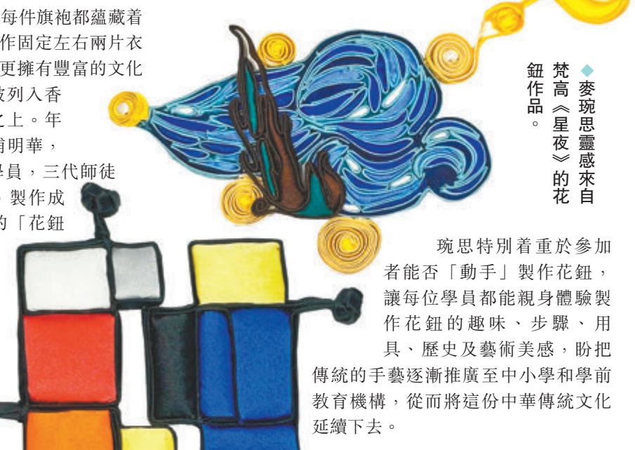
◆麥琬思靈感來自梵高《星夜》的花鈕作品。

琬思特別着重於參加者能否「動手」製作花鈕，讓每位學員都能親身體驗製作花鈕的趣味、步驟、用具、歷史及藝術美感，盼把傳統的手藝逐漸推廣至中小學和學前教育機構，從而將這份中華傳統文化延續下去。