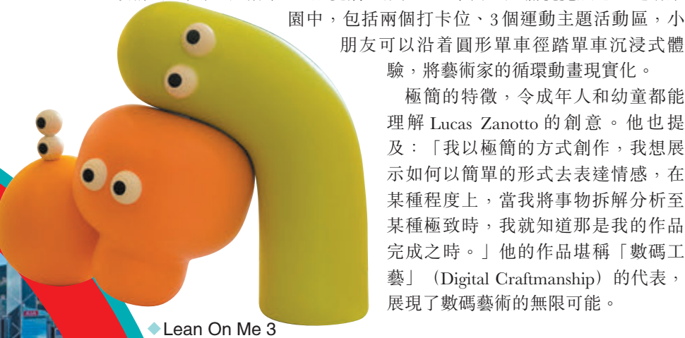
◆Lean On Me 3