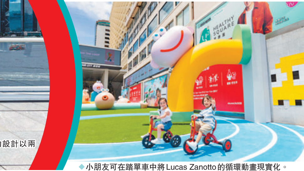
◆小朋友可在踏單車中將 Lucas Zanotto 的循環動畫實現化。