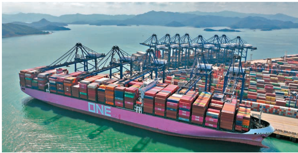
◆內地發布「中國海洋經濟股票價格指數」，及時反映海洋領域上市公司運行態勢。圖為深圳鹽田港。資料圖片

「海洋經濟」指數以上交所、深交所、北交所、港交所上市公司相關股票為樣本空間，綜合考量海洋屬性、行業覆蓋及財務狀況等情況，篩選排名靠