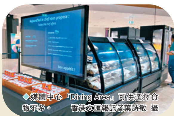
◆媒體中心「Dining Area」可供選擇食物不多。