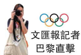
文匯報記者巴黎直擊

巴黎時隔100年再辦奧運，也許全世界都期待能看到時尚大方、別樹一格的奧運。然而不只大會因環保而選手村不設冷氣引起迴響，連記者也不禁對巴黎的主媒體中心（MMC）的「貼地」感到意外，奧運尚未正式開幕，已經率先感受到巴黎奧運極簡主義的風格。