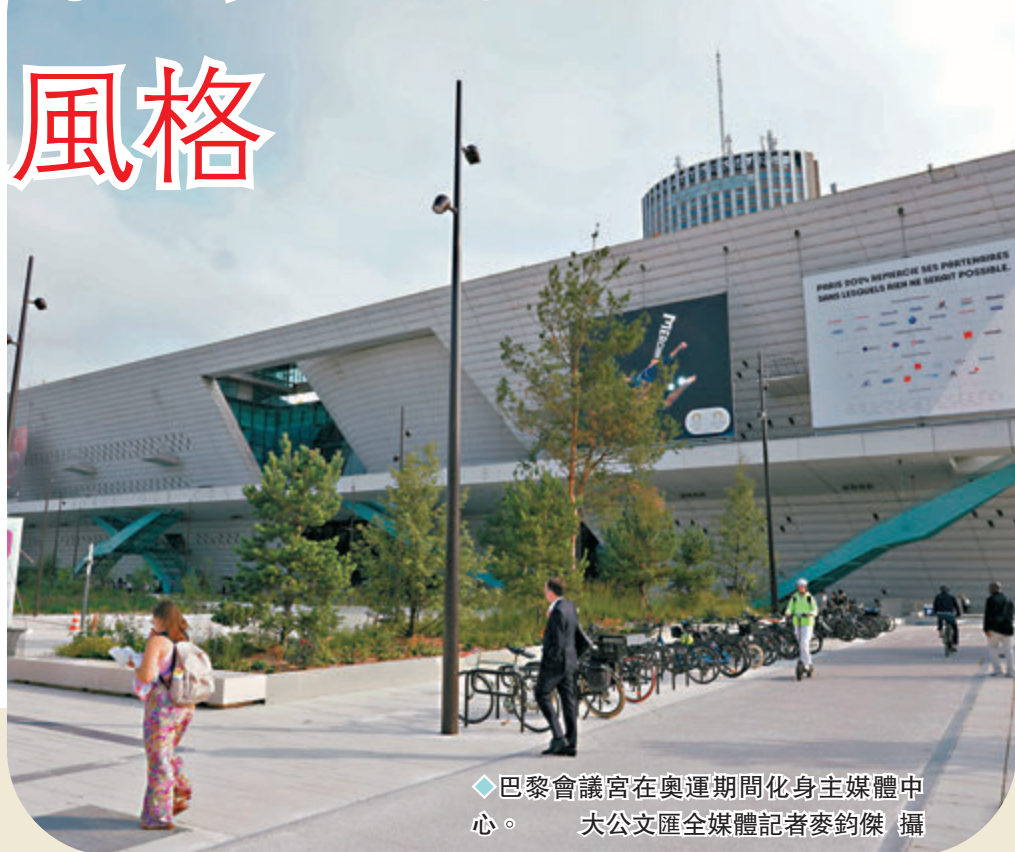
◆巴黎會議宮在奧運期間化身主媒體中心。