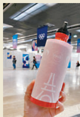
◆這個水樽是今屆奧運媒體包唯一禮品。