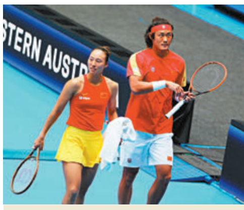
◆中國組合張之臻/鄭欽文取得巴黎奧運網球混雙項目入場券。資料圖片