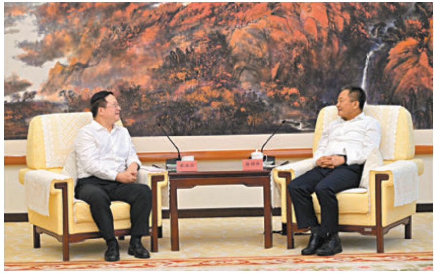
◆內蒙古自治區黨委書記孫紹聘會見香港大公文匯傳媒集團董事長李大宏。

李大宏介紹了集團的發展以及范長江行動——香港傳媒學子內蒙古行採訪活動的相關情況，感謝內蒙古對活動的重視與支持。他說，近年來內蒙古發生了巨大變化，城鄉面貌煥然一新，幹部群眾精神很足，良好的發展勢頭令人印象深刻。香港大公文匯傳媒集團將利用媒體矩陣、國際傳播的優勢，講好內蒙古故事，為推動香港與內蒙古在經濟、文化、人文等領域的交流合作發揮更大作用。