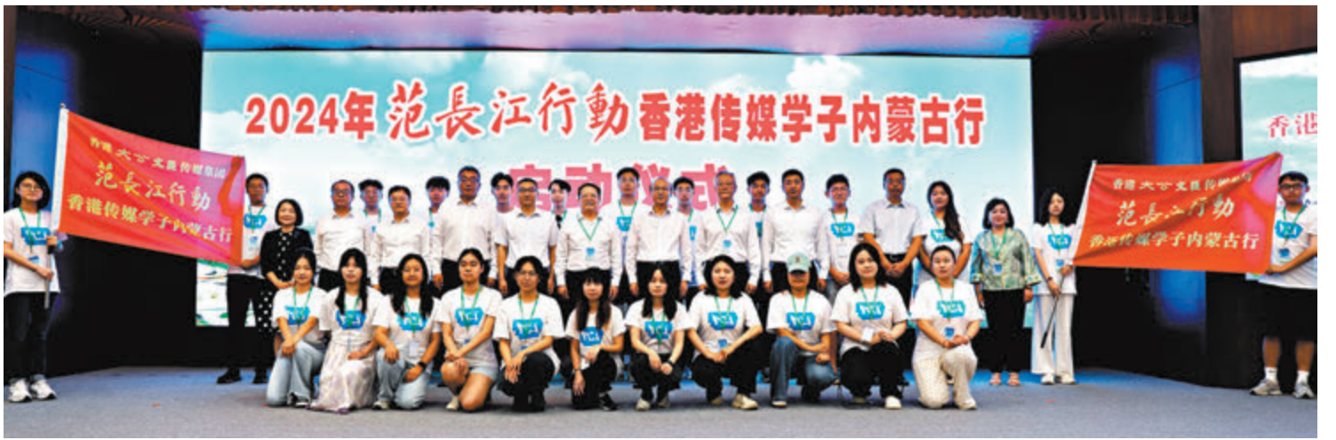
◆與會嘉賓與2024范長江行動——香港傳媒學子內蒙古行採訪團成員合影。

2024年范長江行動——香港傳媒學子內蒙古行昨日在呼和浩特舉行啟動儀式，來自香港和內蒙古的25名學子將作為大公報實習記者，以呼和浩特為起點一路西行，在綠意盎然的內蒙古，實地領略當地科創發展和經濟發展進程，感受悠久的歷史文化底蘊，用文字、圖片和視頻講述他們眼中的內蒙古故事。啟動儀式上，內蒙古自治區黨委常委、宣傳部部長鄭宏範和香港大公文匯傳媒集團董事長、大公報社長、香港文匯報社長李大宏共同見證。內蒙古自治區政府港澳事務辦主任龐輝、內蒙古自治區團委書記喬禮向傳媒學子代表授旗。 ◆文：大公文匯全媒體記者 喬輝、顏琨 呼和浩特報道