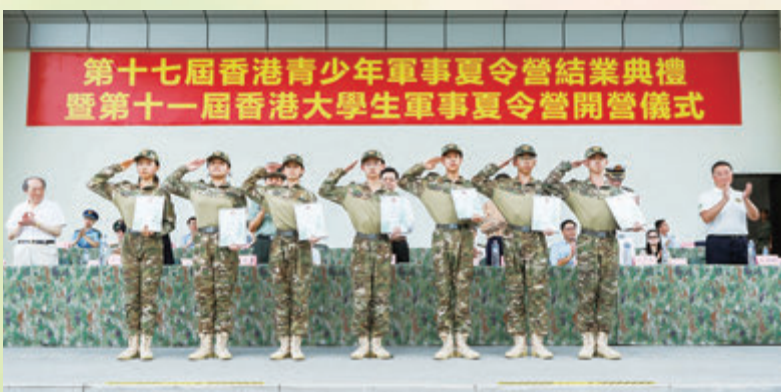
◆學員代表於台上領取結業證書。