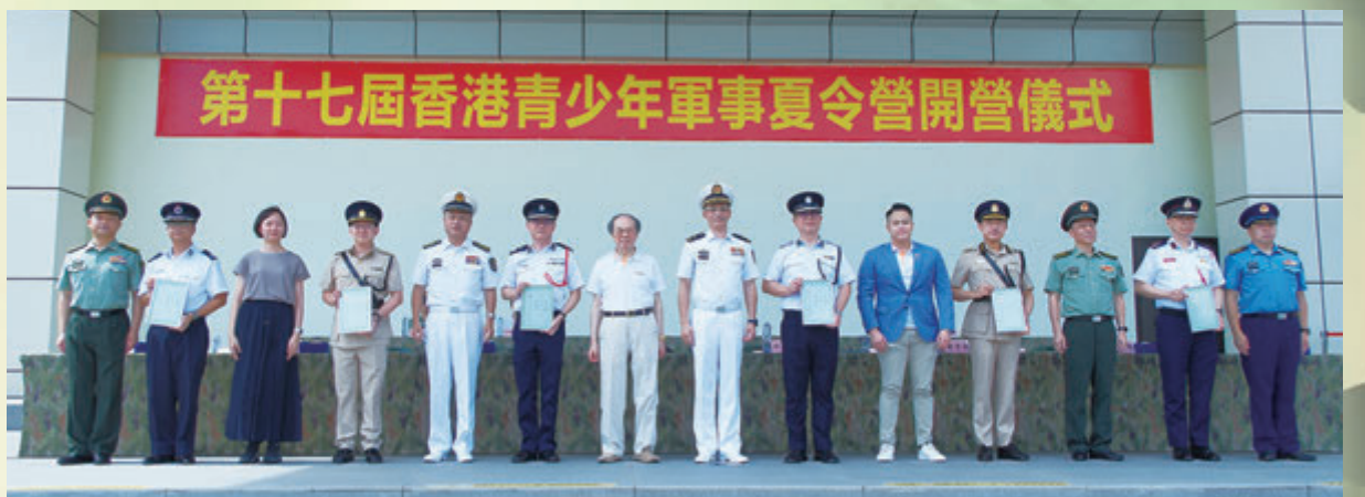
◆活動能夠順利完成，有賴本港各紀律部門派出義務活動人員參與及支持。

第十七屆香港青少年軍事夏令營結業典禮於7月20日假中國人民解放軍駐香港部隊新圍軍營舉行，邀得香港特區行政長官李家超、中央政府駐港聯絡辦副主任盧新寧、外交部駐港公署特派員崔建春、駐香港部隊司令員彭京堂，以及羣力資源中心會長戴德豐等出席典禮。來自香港130多所中學約500名青少年身穿整齊制服，在雄壯的國歌聲中，隆重舉行莊嚴的升國旗儀式，向在場嘉賓和家長們展示過去一周的訓練成果。