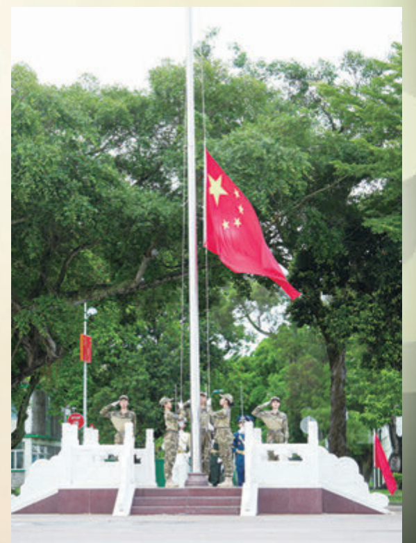
◆由學員親自負責升國旗儀式。