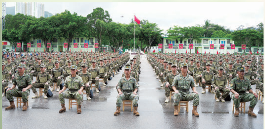
◆學員們參與為期7天的軍事課程訓練。