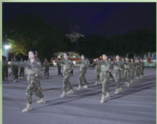
◆輾國不讓鬚眉，女學員在晚上也努力練習軍體拳。