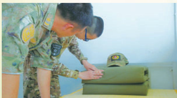
◆學員除了日常鍛鍊，起居也須做到井井有條。