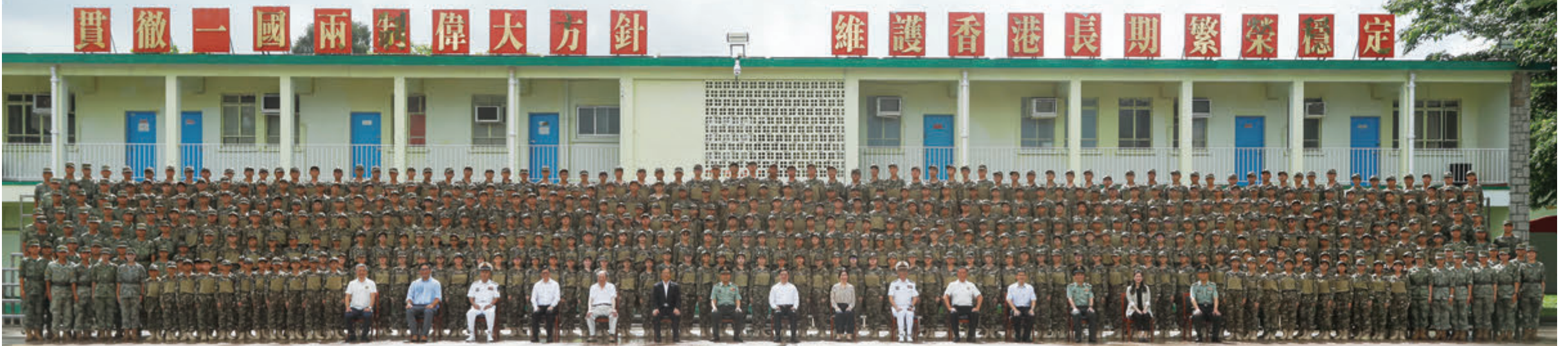
◆第十七屆香港青少年軍事夏令營大合照。

第十七屆香港青少年軍事夏令營結業典禮於7月20日假中國人民解放軍駐香港部隊新圍軍營舉行，邀得香港特區行政長官李家超、中央政府駐港聯絡辦副主任盧新寧、外交部駐港公署特派員崔建春、駐香港部隊司令員彭京堂，以及羣力資源中心會長戴德豐等出席典禮。來自香港130多所中學約500名青少年身穿整齊制服，在雄壯的國歌聲中，隆重舉行莊嚴的升國旗儀式，向在場嘉賓和家長們展示過去一周的訓練成果。