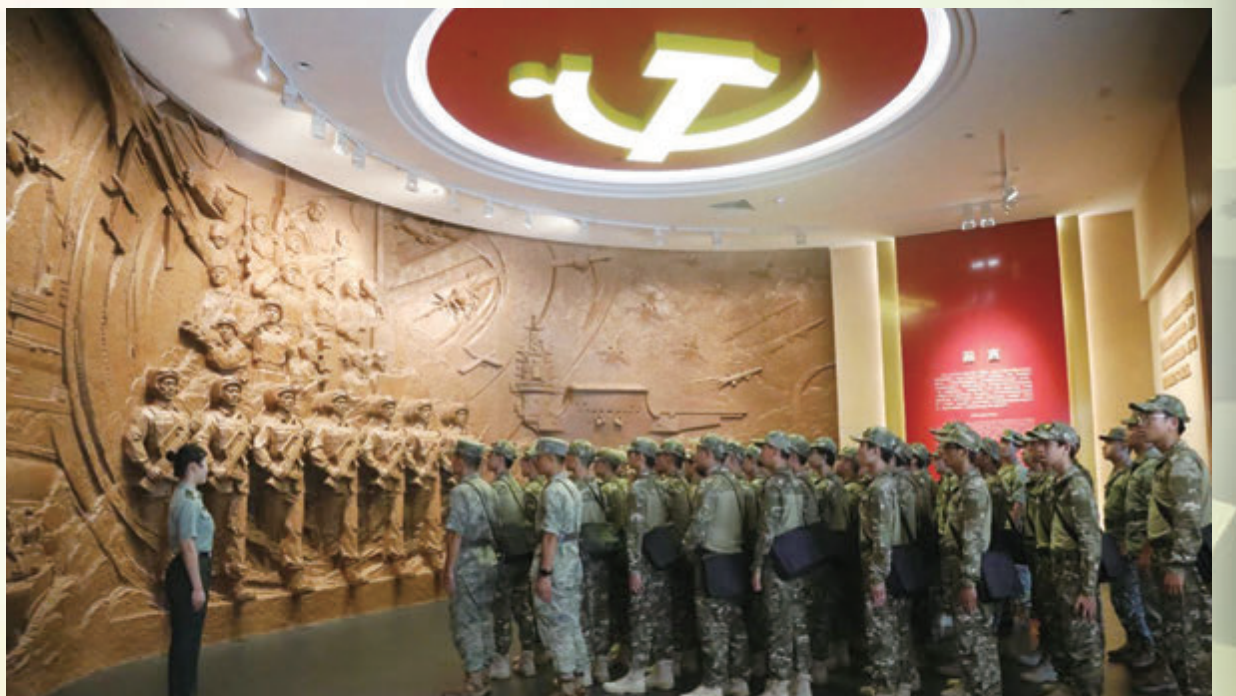
◆學員參觀駐香港部隊展覽中心，認識祖國歷史。