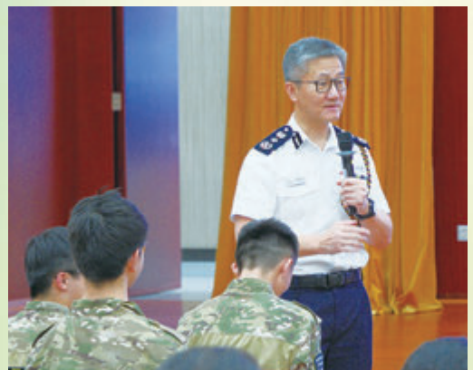
◆營內德育講座邀得警務處處長蕭澤頤分享寶貴經驗。