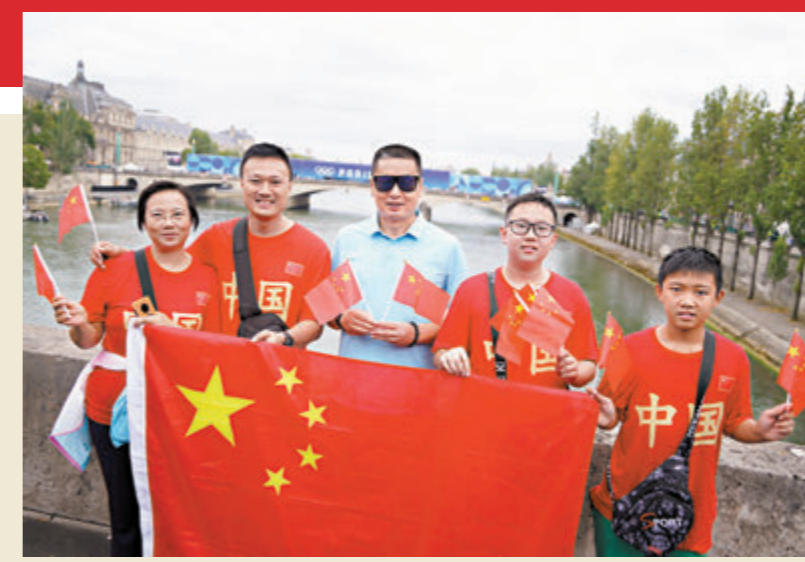
塞納河畔，一家來自廣東順德的遊客，向文匯報記者展示他們為奧運健兒助威而準備的國旗。