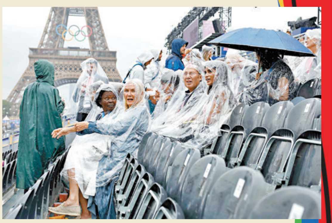
開幕式開始前下起大雨，仍無減遊客的觀看熱情。