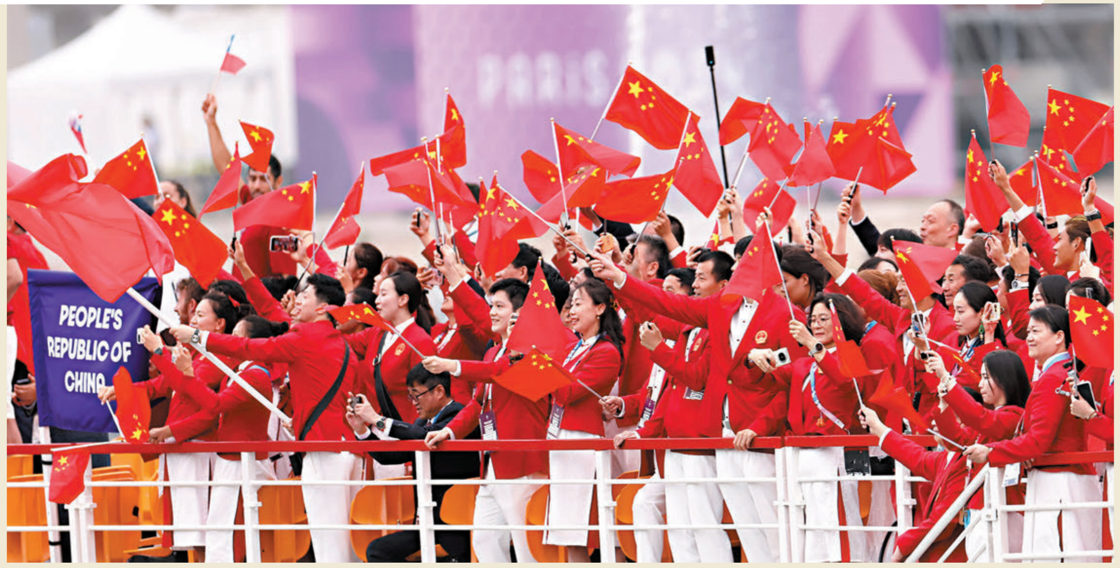
7月26日，中國體育代表團在開幕式上。