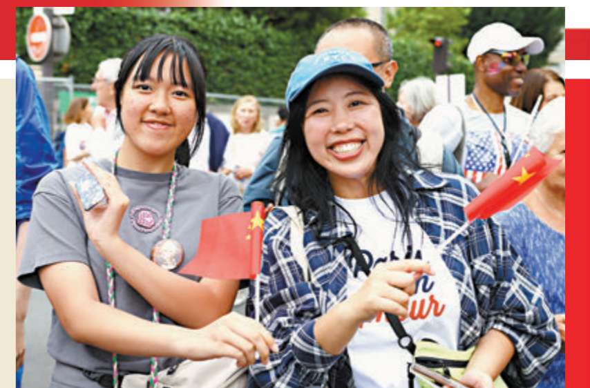
中國遊客準備入場欣賞奧運開幕式。