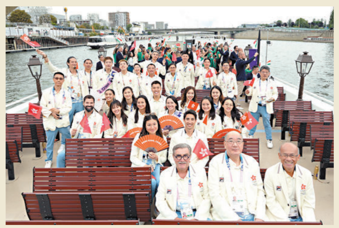
7月26日，中國香港體育代表團在開幕式上。