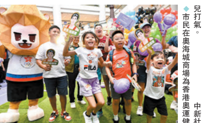
市民在奧海城商場為香港奧運健兒打氣。

運動員沿着塞納河巡遊 今屆奧運開幕式破天荒移師室外舉行，逾萬位來自超過200個國家及地區的運動員沿着塞納河巡遊，路線全長6公里，沿途有法國特色的文藝、音樂及舞蹈表演等，經過包括巴黎鐵塔、羅浮宮、巴黎聖母院及大皇宮等著名地標，到達特羅卡德羅廣場，並以巴黎鐵塔為背景，在結合音樂、舞蹈及燈光秀等融入法國文化及藝術元素的表演後，舉行點燃奧運聖火儀式。 為配合今屆「奧運更開放」的口號，大會安排約22萬觀眾可於塞納河上游免費觀禮，而下游較近位置設有10萬個購票觀眾位置，以讓更多的人可以見證巴黎奧運破天荒式的開幕禮，有不少遊客提早數小時到塞納河畔等候開幕式展開，即使開幕式開始前下起大雨仍無減遊客熱情，有中國遊客表示以往曾觀賞北京奧運開幕式，認為非常精彩，因此這次特意前來巴黎觀賽。