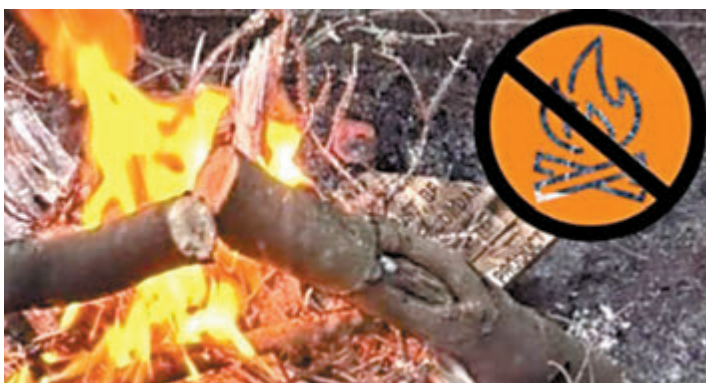
◆ 當局於山火季節禁止在露營地燃燒木材燒烤。