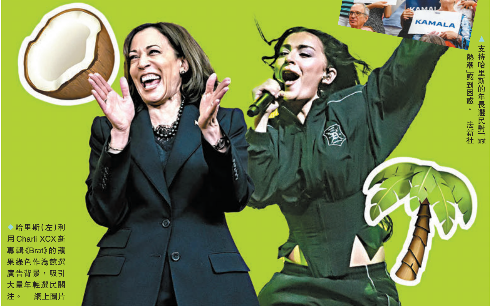
◆ 哈里斯(左)利用Charli XCX新專輯《Brat》的蘋果綠色作為競選廣告背景，吸引大量年輕選民關注。

部分年輕選民認為，哈里斯與brat相關聯能夠傳遞「積極樂觀的理念」，社媒上亦有不少結合哈里斯大笑相片的搞笑貼圖流傳，表達一些年輕選民對她的支持。