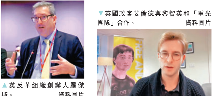
▲英國政客裴倫德與黎智英和「重光團隊」合作。資料圖片