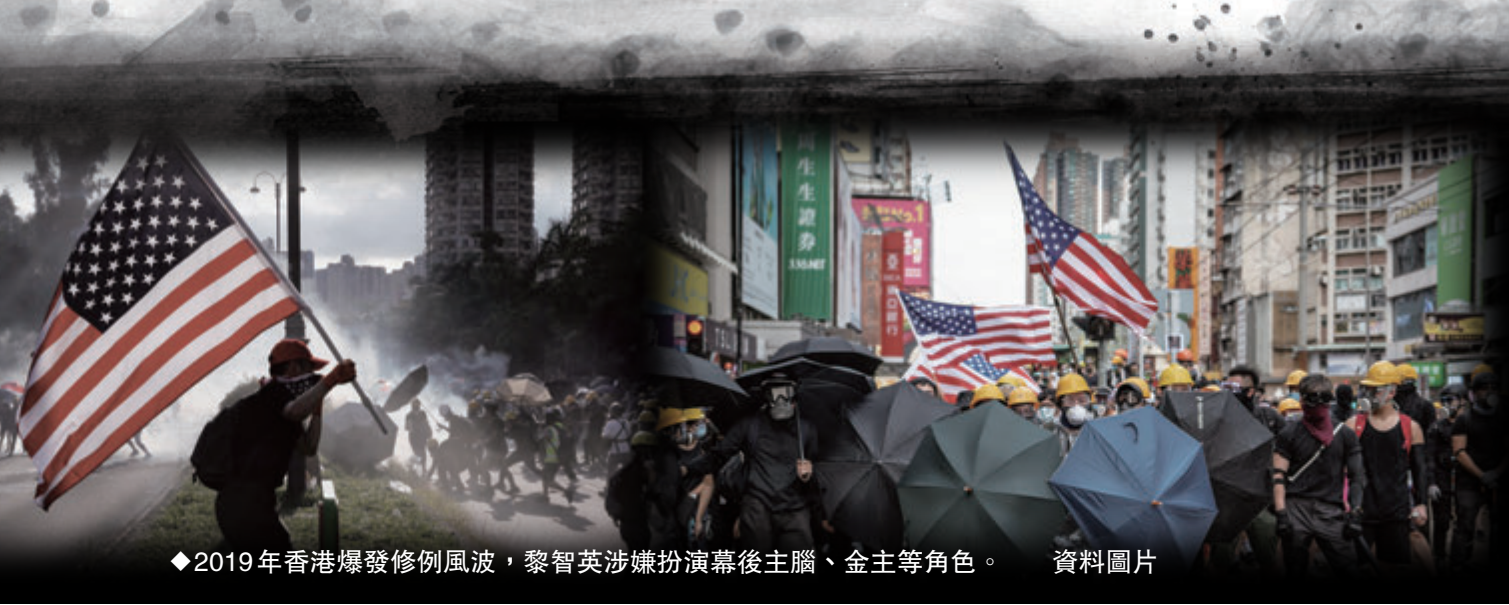
◆2019年香港爆發修例風波，黎智英涉嫌煽動演後主腦、金主等角色。資料圖片