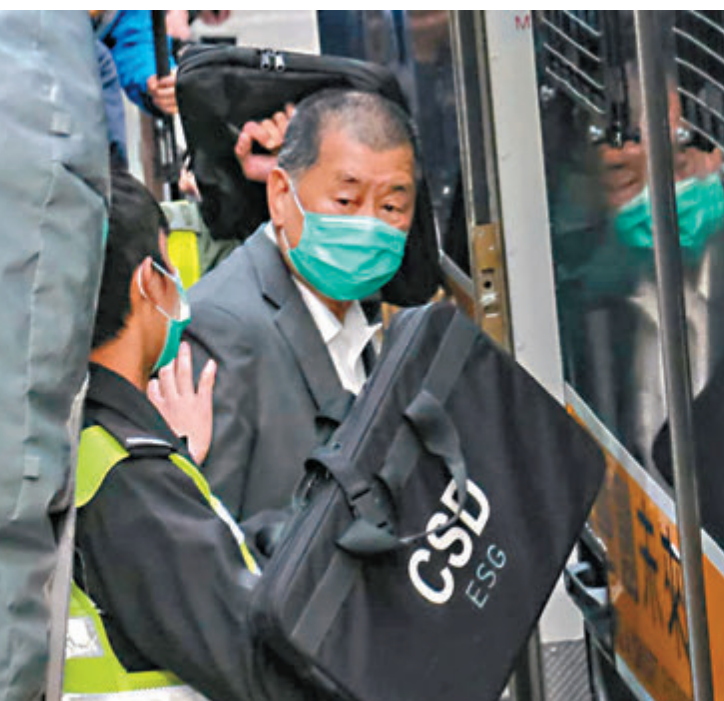
◆黎智英被控兩項串謀勾結外方危害國家安全罪及一項串謀刊印煽動刊物罪，日前3項控罪被法庭裁定表證成立。資料圖片