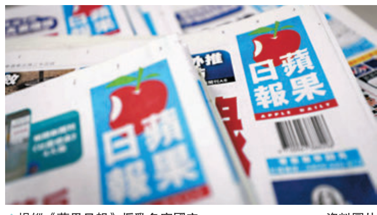
◆操縱《蘋果日報》煽亂危害國安。資料圖片