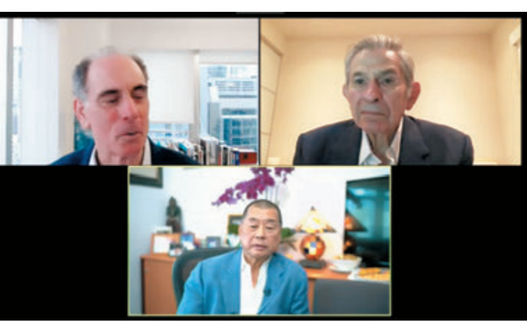
▲英反華組織創辦人羅傑斯。資料圖片

▲黎智英與美國國防部前副部長Paul Wolfowitz（右上）在社交平台進行直播，涉及干預香港內部事務。視頻截圖