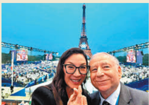
◆楊紫瓊與老公現場觀賞巴奧開幕禮。