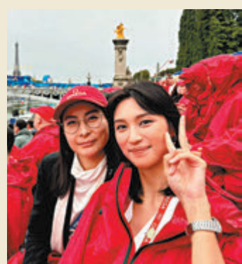
◆王丹妮在巴黎喜遇「跳水皇后」郭晶晶。

年尾結婚都好似有機會咁樣一齊出遊，所以今次對我哋兩個都更有特別意義；我哋兩個睇完開幕禮之後，仲睇埋七人檯球、沙灘排球、游泳、柔道等，行程非常緊湊豐富。Sheldon以前大學時候玩過檯球同柔道，所以佢都睇得特別興奮！我自己以前有打排球，所以亦都好期待睇沙灘排球。但係我哋兩個最期待嘅一定係游泳！能夠睇現場大聲支持港隊，為港隊吶喊助威，興奮心情難以形容，亦都希望港隊可以繼續再創佳績！」