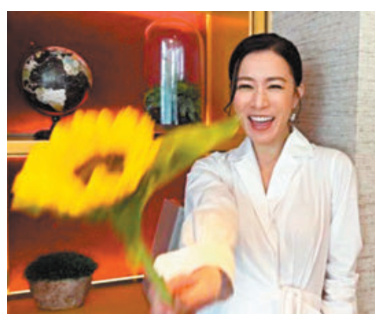
◆佘詩曼昨日心情愉快，再晒個人美照。

心急同緊張，但見到嚟到2024年，巴黎奧運（佢）今次終於圓夢喇，咁我戰戰兢兢訓練十分高興。」在頒獎禮後，Coco即時與Vivian隔空連線，再度感動到眼濕濕的Coco問Vivian有否享受比賽，Vivian先向Coco笑說：「場地係你鍾意嘅紫色，好靚呀！」之後Coco問回到選手村第一件事會做什麼？Vivian可愛地說：「我要食士多啤梨！」此得Coco笑逐顏開，錄影廠其他主持則同聲讚Coco了解Vivian：「估中晒！」Vivian則說：「好多謝你送畀我嘅士多啤梨花同埋祝福。」Vivian說罷對着鏡頭狂派飛吻，Coco則以心心手勢回敬，畫面十分有愛。