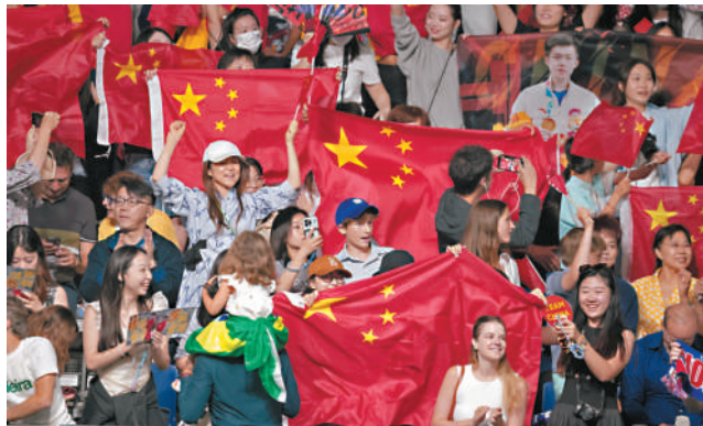
◆觀眾揮舞國旗支持中國奧運健兒。