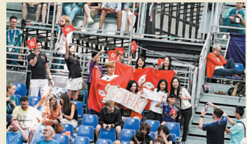
◆不少港人專程到巴黎大皇宮為張家朗打氣。

張家朗在東京奧運決賽最後一刺，穿過電視直播牽動數百萬香港市民的心跳和情緒，「張家朗」、「奧運金牌」等關鍵字，在香港已變成非僅是體育的事，他成了一個熱話，也掀起了這城市的體育熱潮；他由一名24歲劍手，一夜之間成了香港人幾乎無人不