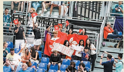
◆不少港人專程到巴黎大皇宮為張家朗打氣。

張家朗在東京奧運決賽最後一刺，穿過電視直播牽動數百萬香港市民的心跳和情緒，「張家朗」、「奧運金牌」等關鍵字，在香港已變成非僅是體育的事，他成了一個熱話，也掀起了這城市的體育熱潮；他由一名24歲劍手，一夜之間成了香港人幾乎無人不