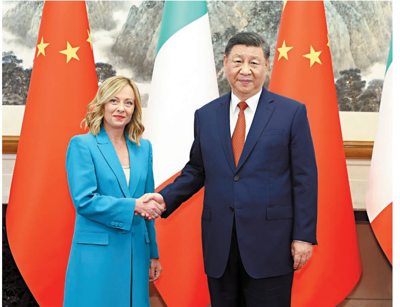
◆7月29日下午，國家主席習近平在北京釣魚台國賓館會見來華進行正式訪問的意大利總理梅洛尼。

香港文匯報訊 據新華社報道，7月29日下午，國家主席習近平在北京釣魚台國賓館會見來華進行正式訪問的意大利總理梅洛尼。