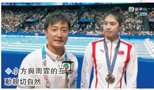
小方與雨霏的互動親切自然。

香港文匯報訊（記者 梁靜儀）翡翠台上周（22日至28日）收視出爐，梁芷珊（Christy）和「奧運之星」鄭衍峰主持旅遊節目《巴黎奧運潮什麼》最高收視10.2點；奧運開幕禮熱身節目《全城起動迎奧運》最高收視8.3點。周六、日下午直播《2024巴黎奧運 下午直擊》最高收視分別為9.1點及9.8點；周六、日深夜時段直播《2024巴黎奧運 重點直擊》最高收視分別為7.7點及10.4點。上述兩個時段的巴黎奧運直播節目，較平日節目收視增加近倍。至於周六、日黃金時段直播《2024巴黎奧運 黃金直擊》最高收視分別為14.5點，94萬觀眾收看，及15.4點，有100萬觀眾追睇。