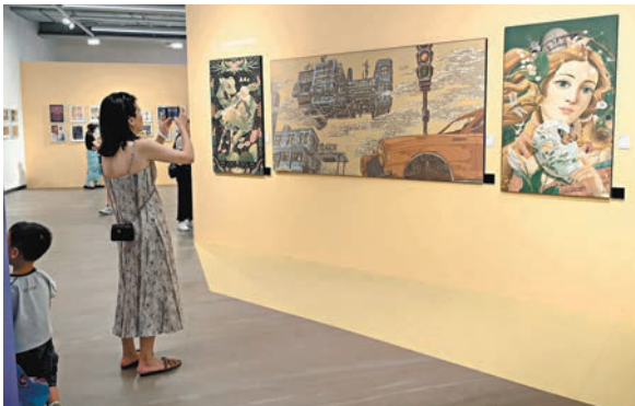
▲展覽共展出2,000多幅頂尖插畫作品。

未來，雙方將持續深化合作，通過品牌聯合活動，整合插畫協會的藝術創作能力和郵政品牌的獨特資源優勢，共同研發具有市場競爭力和文化特色的聯名文創產品。