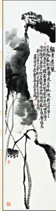
▲徐若鴻作品《和月颯風》，2019年，138x35cm