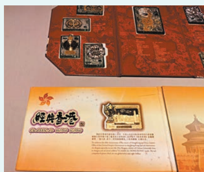
▲朱炳仁作品《經典香港》青銅書票。