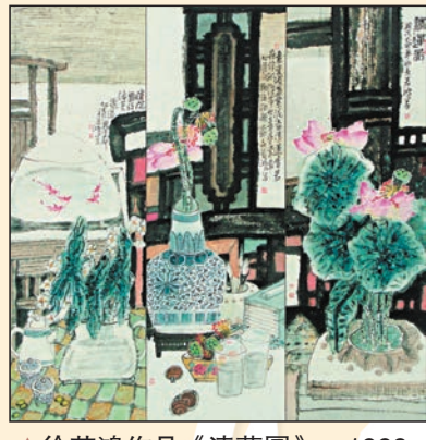
▲徐若鴻作品《清蓮圖》，1999年，133x133cm

徐若鴻不輕易賣畫，也時常推脫簽約作畫的邀請，更不願為了參展獲獎而創作。他說，畫畫的最高境界就是個自由自在。在他看來，畫中一切都和心靈相通，筆墨會隨心靈反映出生命中的體驗，那是一種自然的流淌。「浮躁的時候，你不能認真地沉下心來，去思考一些自己內心有感的东西，你就會慢慢麻木。」他的藝術創作亦由此進入了大寫意水墨花鳥的新階段。