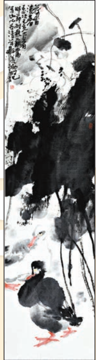
▲徐若鴻2019年作品《荷香清暑》，138x35cm

在徐若鴻作品《風荷》的題跋處，他這樣寫道：「有意於畫，筆墨每去尋畫，無意於畫，畫自來尋筆墨，蓋有意不如無意之妙耳。」對徐若鴻來說，從「有意」到「無意」，是一條沒有止境的探索之路。1957年出生，徐若鴻至今仍懷著最初畫畫時那份近乎癡迷的熱愛，而他筆下的墨荷，已逐漸從繁複轉而簡約，從設色轉而黑白，縈繞著恬淡空靈、天然混沌的筆墨韻律。