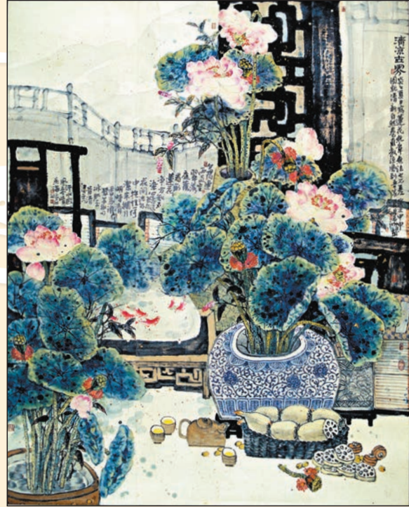
▲徐若鴻作品《清涼世界》，2004年，175x142cm