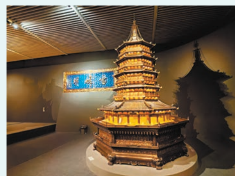
▲朱炳仁作品《雷峰塔》。