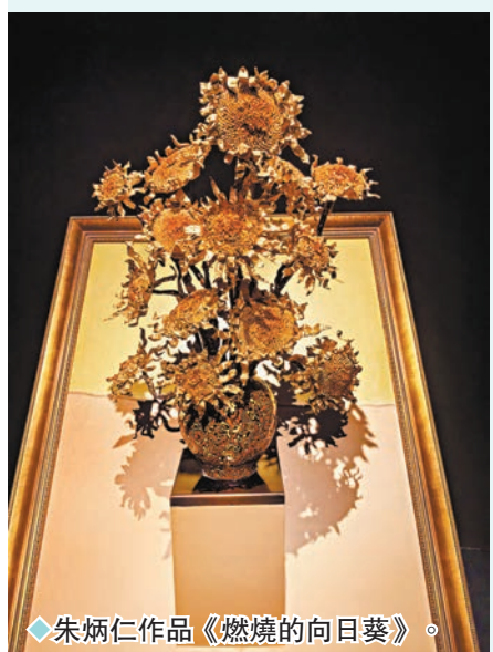
▲朱炳仁作品《燃燒的向日葵》。

步入展廳，彷彿進入了一個「銅話」的世界。中國第一座彩色銅雕寶塔——雷峰塔的建築藝術品，第一座銅橋「涌金橋」，及代表中國銅壁畫創作高峰的《萬泉歸海》等經典作品悉數亮相。國博珍藏的熔銅藝術開山之作——《闕立》，時隔十七年再次與觀眾見面，與《稻道道，非常稻》《千里江山》《燃燒的向日葵》等作品，共同演繹了一場形意交織的雙重盛宴。朱炳仁的新作《黃河奔騰》，為獻禮建國75周年而作，以九曲黃河為靈感，彰顯中華民族的堅韌精神。《運河之光》則通過對運河的描繪，展現「運河三老」之一的朱炳仁對中國大運河的關注與讚美。展覽還特別設置互動體驗區，讓觀者有機會親手觸摸銅雕藝術的溫度，感受來自金屬的質樸和力量。