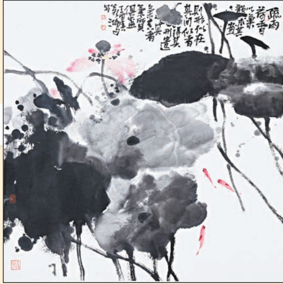
▲徐若鴻作品《疏雨荷香》，2017年，68x68cm