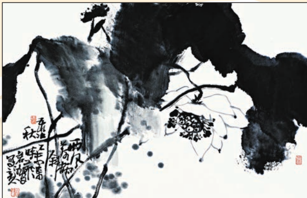
▲徐若鴻作品《西風塑荷》，2015年，68x45cm