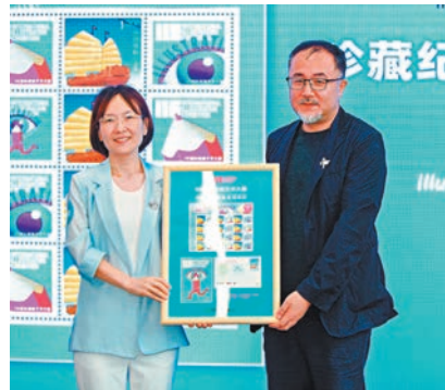
▲IIE 國際插畫藝術大展首發珍藏郵票。

珍藏郵票的主票以「一帆風順」為靈感，融合傳統與現代美學元素，象徵著對未來的完美期許，如同一艘希望之船在插畫藝術的海洋中破浪前行，體現著藝術家們對夢想的執著追求。郵票附票與明信片主畫面精選自IIE 的標誌性設計，以獨特視覺語言詮釋插畫藝術核心理念，引領大眾走進色彩斑斕、創意無限的插畫世界，展現了IIE精