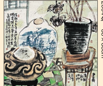
▲徐若鴻作品《書齋清趣》，2004年，68x68cm