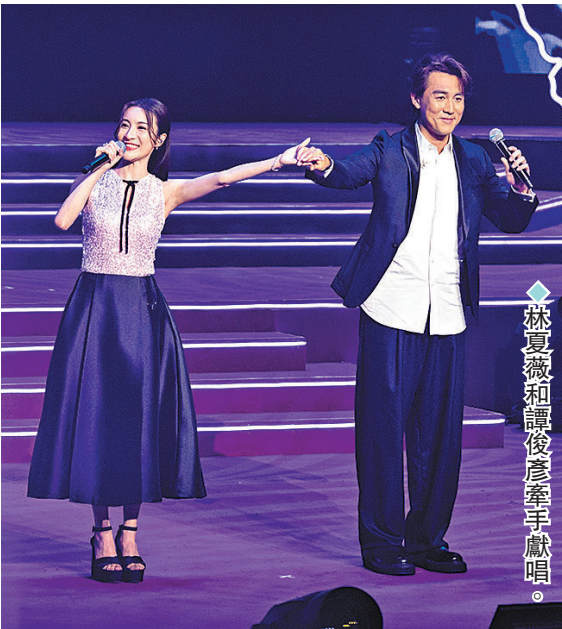
林夏薇和譚俊彥牽手獻唱。