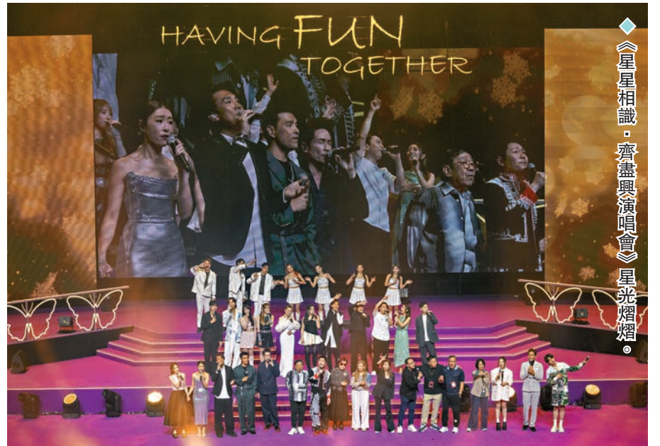
《星星相識·齊盡興演唱會》星光熠熠。