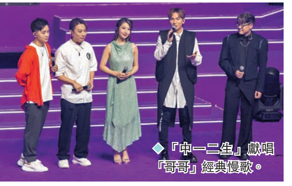
「中一三生」獻唱「哥哥」經典慢歌。

陳太表示：「多謝今晚在台上的每一位藝人，在百忙中抽空出席今晚的演出。今天很多佢哋嘅粉絲也有來到倫敦人現場，希望你們以後會繼續為支持的偶像加油，希望今晚大家都盡興。」