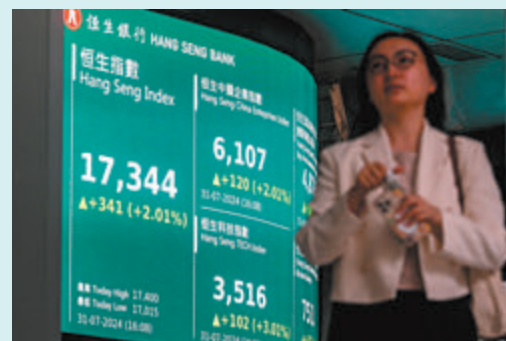
◆恒指昨天高開後升幅持續擴大，全日升341點，收報17,344點。

市場憧憬內地會再出招刺激消費，港股中，昨日內需股續反彈，安踏（2020）升3.5%、海爾智家（6690）升