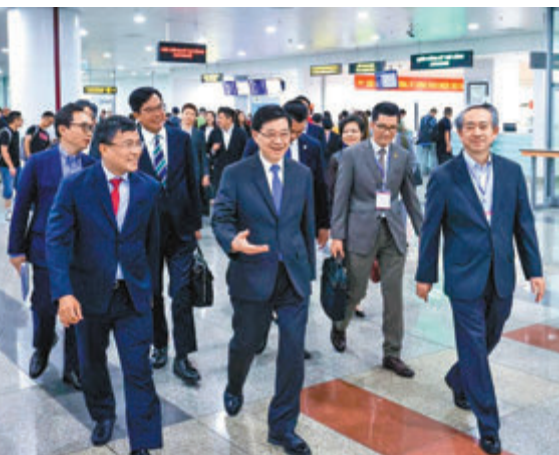
◆李家超昨日轉抵越南訪問。

他以電動汽車、儲能風電等綠色能源為例，表示香港在這範疇有非常好的上市公司在運作，越南的綠色金融、綠色債券等都可以到香港找到最佳的合作者。同時，香港有多所世界百強大學，基礎研究能力超強，可以與越南的