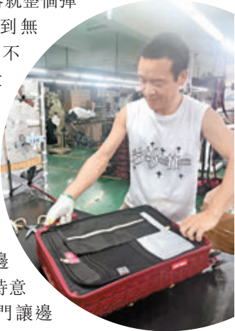
◆「英俑」行李箱製作中。

更嚴苛的是「跌落」測試——裝載25公斤砝碼的行李箱被人從兩層樓高度用力拋下，地面的工作人員會上前檢查行李箱是否因此產生嚴重變形。「一跌落就整個彈開，或者變形到無法打開，都是不可接受的質量問題。」白劍峰笑着說，「我們的檢測團隊可『狠』了，為了測試行李箱最脆弱的四個邊角，他們還會特意斜着拋下，專門讓邊角去撞擊地面。」