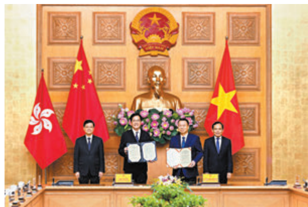
◆李家超(左一)與越南副總理陳流光(右一)見證香港和越南簽署合作備忘錄。