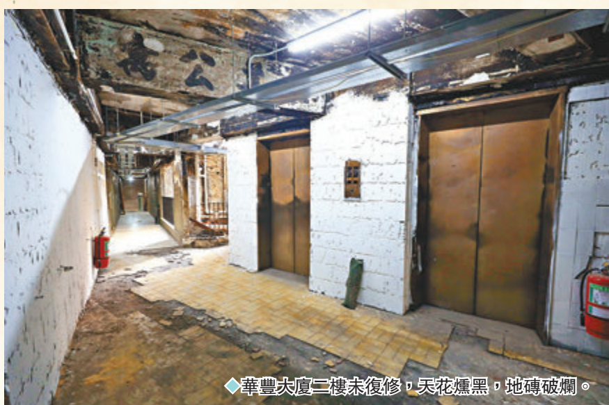
◆華豐大廈二樓未修復，天花燻黑，地磚破爛。