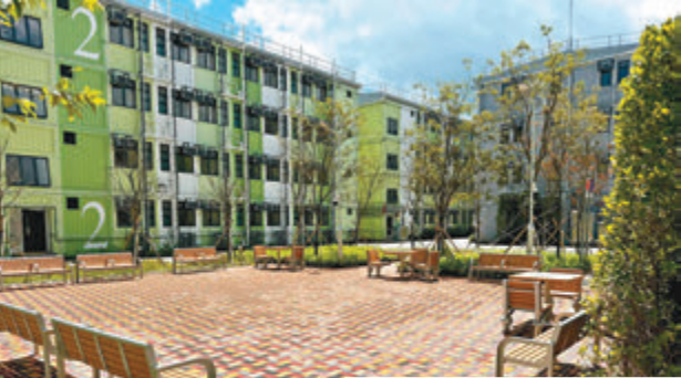
▲大埔樂善村提供1,236個過渡性房屋單位。

香港文匯報訊（記者 王偉）由特區政府房屋局資助、會德豐地產以1元象徵式租金租出土地、九龍樂善堂負責興建和營運的大埔樂善村，提供1,236個過渡性房屋單位，反應踴躍，由開始招募至今，共接獲逾2,400份申請，並於今年4月開始陸續讓合資格申請人入伙。項目分下台及上台位置，目前下台500多戶入住率超過95%，上台完成環境優化工程及單位裝修後，將陸續開放予申請人入伙，預計3個月內完成餘下700多戶入伙。