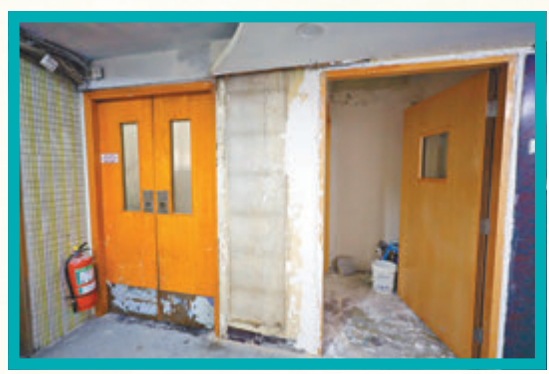
◆華豐大廈防煙門緊閉，部分樓層正安裝新的防煙門。