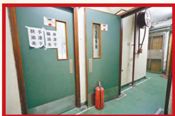
◆新興大廈防煙門打開，更發現未有標籤滅火筒。