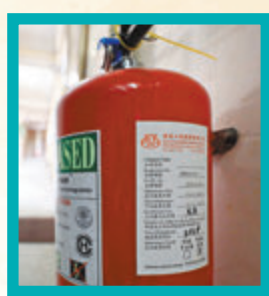
◆華豐大廈每層走廊有多個滅火筒，均已完成檢查，未有過期。