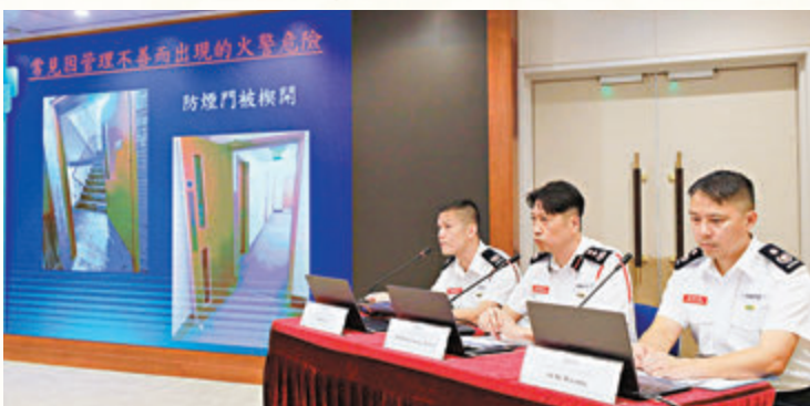
◆消防處特別執法行動簡報會。