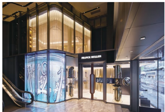
◆ FRANCK MULLER全新中環旗艦店位於中環新世界大廈。

獲譽為「複雜功能製錶大師」的瑞士高級腕錶品牌FRANCK MULLER，多年來以精湛製錶工藝結合創意巧思，製作無數令人愛不釋手的名貴腕錶。為向香港的腕錶愛好者呈獻更多腕錶傑作，FRANCK MULLER隆重宣布取址中環新世界大廈開設全新旗艦店，讓大家盡情欣賞及選購品牌一系列腕錶珍品。