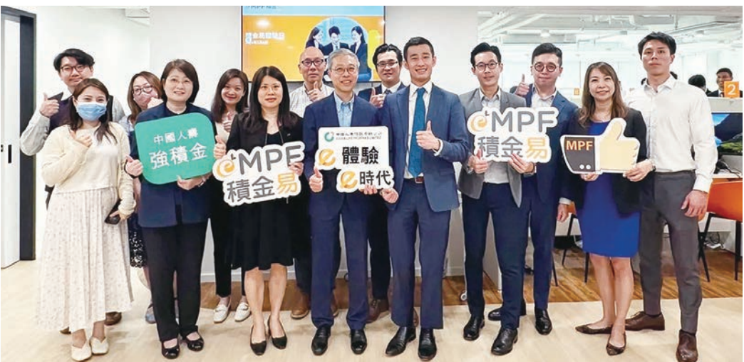
◆ 中壽信託透過舉辦「積金易」體驗日等活動推動業務發展。

中國人壽保險（海外）股份有限公司旗下中國人壽信託有限公司（「中壽信託」）日前宣布，於7月29日起正式使用「積金易」平台（eMPF）處理強積金行政工作，為本港第二間加入平台的強積金受託人。中壽信託強積金計劃下的成員及僱主由當日起經註冊「積金易」後，可享用此一站式綜合電子平台的各項功能，隨時隨地輕鬆管理強積金。