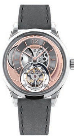
◆ MEMOIRE推出的首枚腕錶命名為Aspirare陀飛輪腕錶。

Aspirare陀飛輪腕錶不僅體現了瑞士製表工藝的精髓，更融入了香港國際化的美學視角。腕錶直徑40毫米，表盤用上近年流行的三文魚色作主調，經噴砂處理並加入直線條作點綴，多層次灰色環狀表盤以立體時間刻度，令設計更富時代感。製表工匠精心設計鏤空表盤，方便佩戴者透過藍寶石玻璃直接欣賞機芯零件外，更於發條盒上鑄刻SWITZERLAND及HONG KONG字樣，文字隨時間流逝慢慢轉動，作為是次跨國合作的見証。