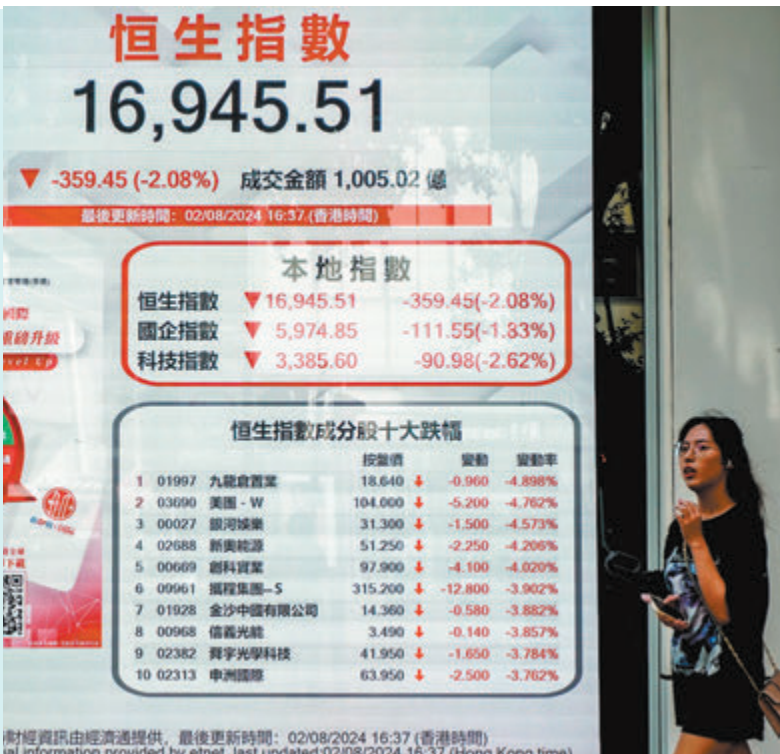
◆恒指昨曾瀉439點，收市跌幅收窄至359點，仍失守萬七點大關，大市成交1,005億元。中通社

美國上週初申領失業金的人數超預期，首次申領人數創2023年8月以來新高，7月製造業活動亦連續第4個月萎縮，創下8個月來最大萎縮幅度。新數據引發了市場對經濟衰退，以及聯儲局降息恐怕「為時已晚」的擔憂，10年期公債殖利率也自2月以來首次跌破4%水平。美國銀行策略師Masashi Akutsu表示，市場之前的共識一直是「日本漸進加息」，所以當日本央行行長本周突然暗示，未來可能很快會多次加息時，令市場意外。他認為，儘管日圓走強，但日本企業盈利情況看起來仍穩健，一旦美國大選結束，市場可能恢復平穩。