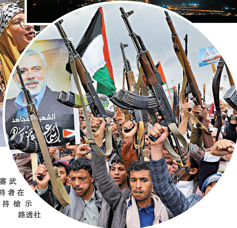
◆ 胡塞武裝支持者在也門持槍示威。