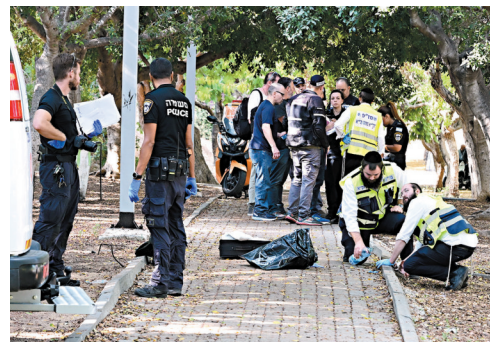
◆ 警員在案發現場搜證。

特拉維夫一名婦人說她覺得沒有安全感，在哈馬斯領導人哈尼亞上週三遇刺身亡後，她便取消當天上午的行程安排。身在特拉維夫的以色列政治專家艾柏提到，以色列民眾雖然緊張，卻也覺得聽天由命，有人甚至認為這就是在敵人窺察下以色列的宿命。