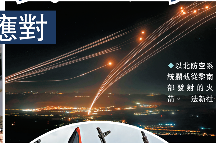
◆ 以北防空系統攔截從黎南部發射的火箭。