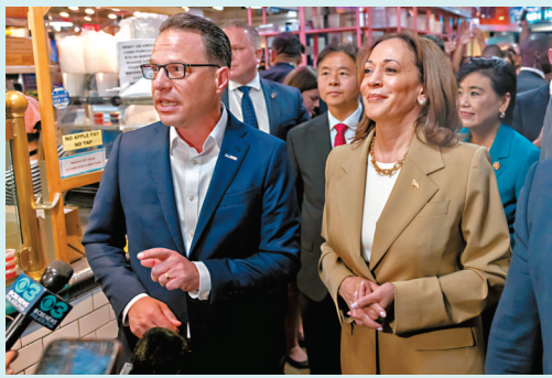
◆ 哈里斯(右)和夏皮羅參觀費城雷丁市集。

據美媒報道，韋萊布是夏皮羅在州議會聯絡人，一名前女下屬稱，韋萊布今年較早時對她發表不恰當、猥褻和性暗示的言論，她最終辭職。州長辦公室悄悄達成一項和解協議，以解決針對韋萊布的性騷擾指控，試圖掩蓋事件。美媒其後披露受害人的投訴書，這份投訴書開始在國會流傳，韋萊布因此於上月底辭職。美媒指出，對性騷擾處理不當，對夏皮羅來說是至今最嚴重的危機。