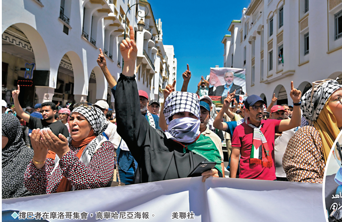
◆ 撻巴者在摩洛哥集會，高舉哈尼亞海報。

另一方面，真主黨周日凌晨向以色列北部發射數十枚「喀秋莎」火箭彈，回應以色列上周六襲擊黎南部地區。由於擔心以色列和真主黨之間爆發全面戰爭，美國、英國和法國等多個國家已要求本國公民盡快離開黎巴嫩。