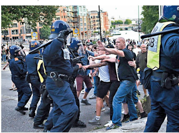
◆ 極右分子在布里斯托爾與警對峙。

桑德蘭一座清真寺成為襲擊目標，現場許多人高叫仇視伊斯蘭的口號，英國穆斯林領袖對此表示擔憂，全英2,000多座清真寺已處於警戒狀態。