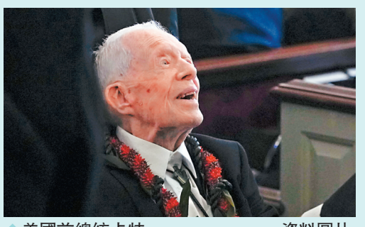
◆ 美國前總統卡特 資料圖片

香港文匯報訊 美國前總統卡特目前是在美國史上最長壽的總統，也是在世的最長美國前總統。已接受安寧療護近一年半的卡特將於今年10月年滿100歲，據美國有線新聞