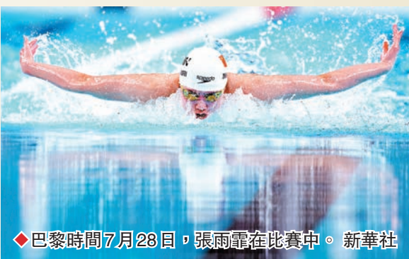
◆巴黎時間7月28日，張雨霏在比賽中。

面，但經過教練的開導教誨，已經逐漸能夠接受不完美的挫折。我只能用不完美的狀態去打出一個完美的成績。」張雨霏說。