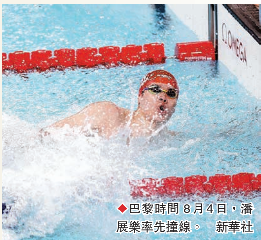
◆巴黎時間8月4日，潘展樂率先撞線。

在巴黎奧運會上橫空出世，潘展樂每次接受採訪都表現出不驕不躁的自信。在男子100米自由泳決賽中，他以46秒40刷新世界紀錄奪冠，打破美、澳選手對該項目的統治，贏得「飛魚大戰」。他的成績甚至讓有的外國教練酸酸地稱「非人類可為」。