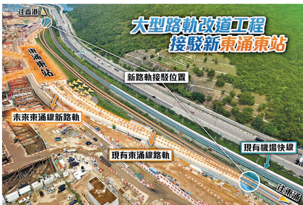
◆配合東涌線延線大型路軌改道工程,10月26日來往東涌至欣澳站尾班車將提前約兩小時開出。