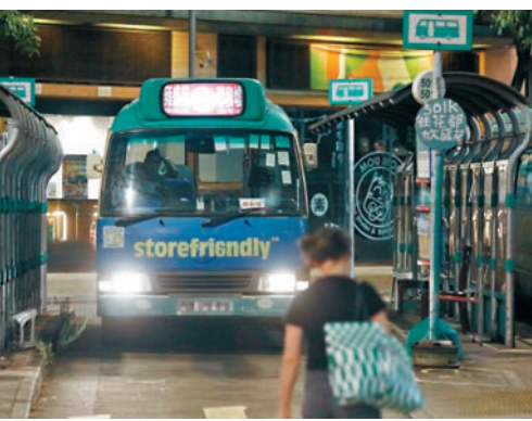
◆多收車費專線小巴營辦商即日起向受影響乘客安排退款。圖為該營辦商的專線小巴線。

支付現金的受影響乘客可於下月4日或之前,在指定時段前往和滿街公共小巴總站,向小巴營辦商職員提供姓名和聯絡等資料,即場以現金取回多付車費。