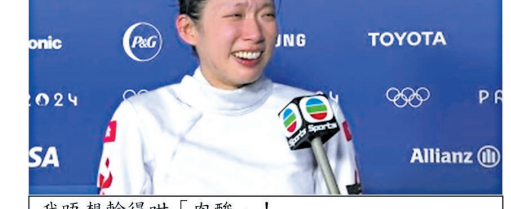
我唔想輸得咁難睇！咁令港人好失成一分一分咬住上！誓要將這金牌搶