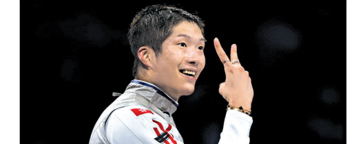
張家朗咁嘅手勢代表咩呀？淺層意義係「勝利」，深層意義就係「杯莊」囉！