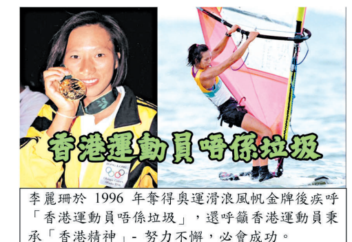
李麗珊於1996年奪得奧運滑浪風帆金牌後疾呼「香港運動員唔係垃圾」，還呼籲香港運動員秉承「香港精神」- 努力不懈，必會成功。