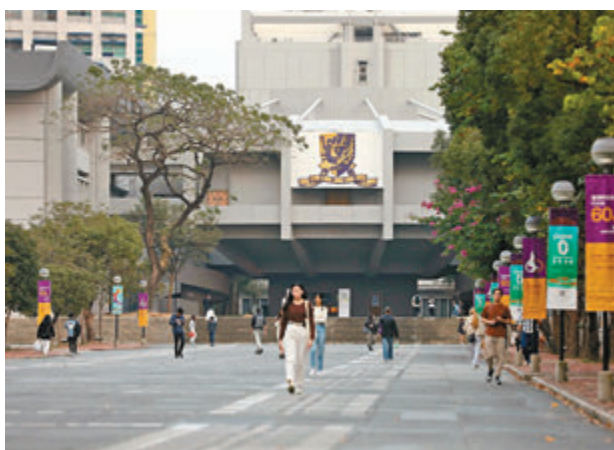
◆5名應屆文憑試超級狀元及狀元選擇入讀香港中文大學醫學院。圖為中文大學校園。

香港文匯報訊（記者 高鈺）2024年度大學聯合招生辦法（JUPAS）今日（7日）上午9時起公布正式遴選結果。今年共有39,634人申請，其中15,776人獲得正式遴選錄取資格，佔申請總人數的39.8%，較去年下降0.63個百分點，另有4,392人獲「指定專業/界別課程資助計劃」（SSSDP）全日制學士學位課程取錄。至於狀元尖子的去向，香港中文大學昨日表示，5名應屆文憑試超級狀元及狀元選擇入讀該校醫學院，而環球醫學領袖培訓專修組別（GPS）更是連續11年成為全港收生成績之冠。至於香港大學則吸納了4名考獲六科5**的狀元。