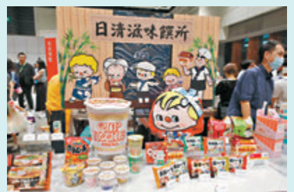
▲日清將於博覽中推出限量福袋。 ▶有本地肉丸品牌於場內設置上世紀於九龍城寨打丸的情景供入場者打卡。