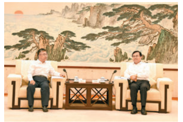
◆山東省副省長宋軍繼(右)在濟南會見參加 2024 范長江行動—香港傳媒學子山東行採訪活動的香港大公文匯傳媒集團副董事長、總經理鄭勇男一行。

來自香港大學、香港浸會大學、香港樹仁大學以及北京大學、南京大學的香港學子們，將在未來 7 天的時間前往濟南、曲阜、泰安、濰博和青島，親身感受山東悠久厚重的歷史文化、壯麗秀美的名山大海、活力十足的繁榮經濟、熱情好客的開放環境，並把所見所聞所思所想帶回香港，書寫中國式現代化的山東故事。