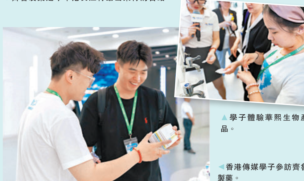
▲學子體驗華熙生物產品。