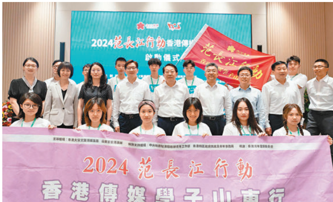
◆2024 范長江行動—香港傳媒學子山東行採訪活動在濟南舉行啟動儀式。