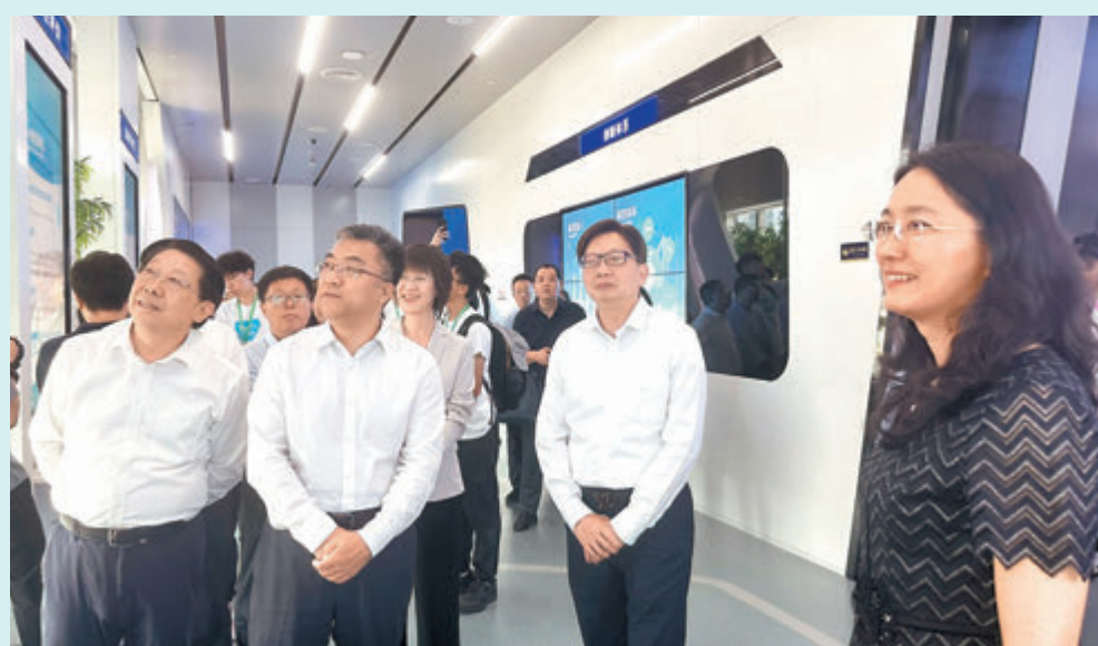
◆齊魯製藥是今年范長江行動山東行的首站。

此行還設計了內容豐富的文化線路：參訪孔廟、孔府，孔子故里體驗傳統文化；登泰山，觀泰山皮影，參訪陸房突圍勝利紀念館；體驗濰博燒烤，與當地大學生聯誼；參訪青島啤酒博物館品嘗鮮美啤酒，打卡百年老街上街里，到青島電影博物館了解電影產業……香港傳媒學子將領略「好客山東」秀美風光，體悟齊魯文化獨特魅力。