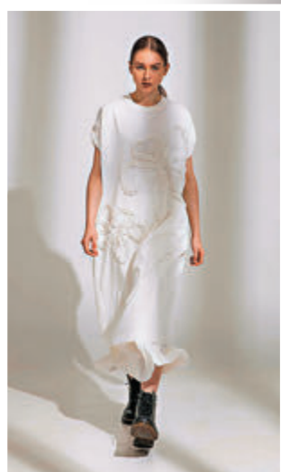
◆ 品牌以鸚尾花為靈感設計