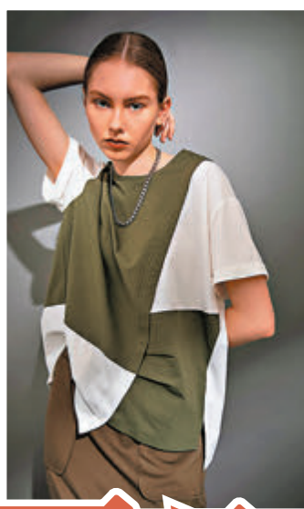
◀ 雙重涼感面料 COOL-MAX & SORONA COOL TOUCH 拼接上衣

除了立體花外，新品更包括以兩種不同顏色的織帶做出重疊 ZIGZAG 及格紋圖案，混搭出簡約層次感設計。同時，品牌亦重視衣服的舒適功能，特選可再生環保纖維 SORONA 涼感面料，清涼透氣且柔軟易打理，穿着舒爽的同時為地球環境和永續貢獻一分力，加上此面料最大特色是以低能源消耗及碳排放生產的可再生人造纖維製成，環保之餘，又切合當下季節的需要，清爽度過夏日。