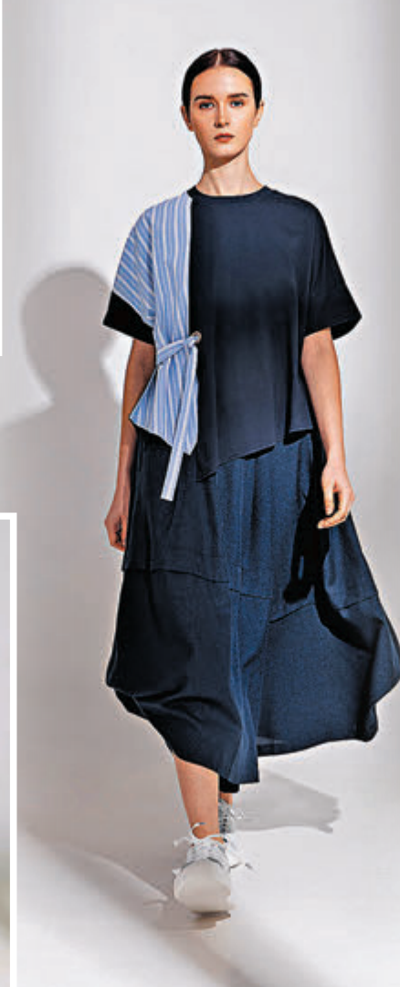
◆ ATSURO TAYAMA 春夏新品