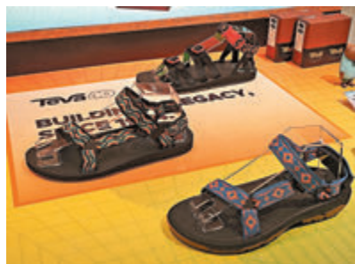
◆ 40周年紀念涼鞋款式