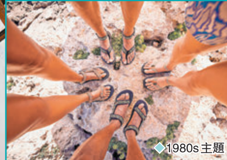
◆ 1980s 主題