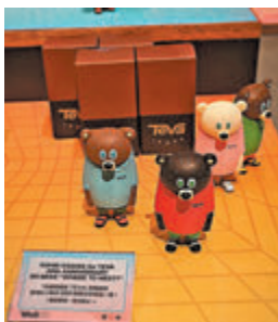
◆ BG BEAR