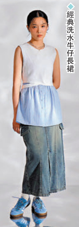
◆ 經典洗水牛仔長裙