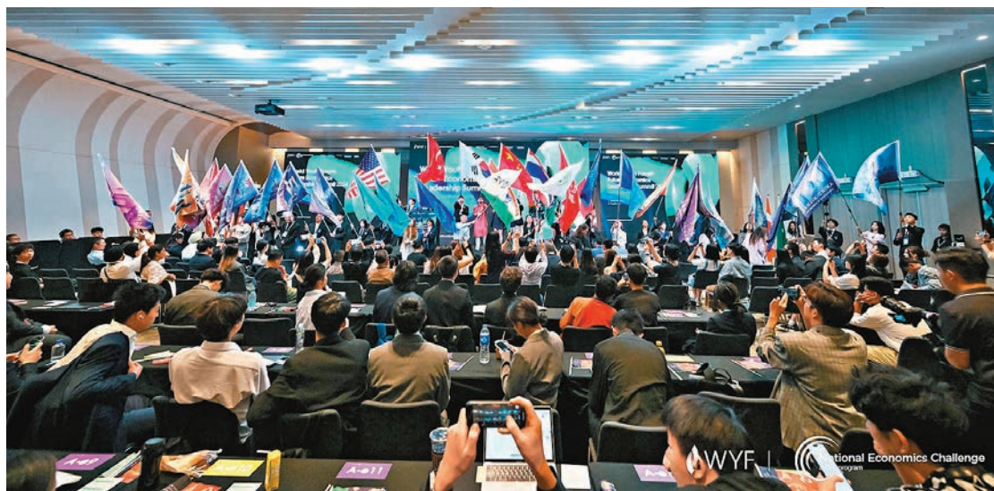
逾三百名來自中國內地、香港和美國、加拿大、印度、巴基斯坦、韓國、土耳其等國家和地區的高中生，參與在港舉辦的首屆全球青年未來財商領袖研習活動。

同場，中國日報亞太分社副總經理譚雁強調，香港是世界金融中心，亦是中西文化的樞紐，作為本次活動的舉辦地點，為全球各地的青年探索多元世界提供了絕佳選擇。