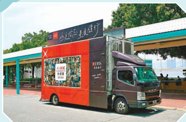
星展銀行昨舉行品牌活動「Trust Your Spark」(燃亮信念星展隨行)，而「AI夢相生成器」快車於8月5日起至8月20日期間啟航巡迴香港，連續兩星期停泊於香港島

和九龍區。「夢相」生成快車的AI人工智能會根據拍照者的外貌生成預視夢想圖，讓孩子有機會預見「成年實現夢想的模樣」。