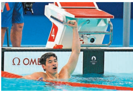
◆ 新一代國民偶像潘展樂奪冠瞬間。

我們曾經在周日經過，發現排隊的人潮幾近迫至電梯口，立即撤退作罷。後來在平日早上入場，但明顯一到午後同樣已人潮洶湧，的而且確不屬愉快的遊樂經驗。不過，我覺得更重要的是玩樂時的禮儀問題，只不過風水輪流轉，現在常見的是內地居民批評港客禮儀「失格」，素質低落。作為遊客之一，我禁不住感到羞恥，而且也確實所言非虛。在Party Day，我親眼目睹不少港爸港媽，不穿防滑襪已屬小事，更加在指定區域內穿鞋隨意走動（其實早已規定一進指定場區就要脫鞋，若想陪孩子玩就要穿防滑襪，沒有帶備可在入口即時購買），委實丟人現眼。其實無論任何場所，基本禮儀不僅是對他人的尊重，更重要的是自己人格的顯現。希望大家在開心玩樂之餘，也可以為子女作好榜樣，同樣不要令港人蒙羞。