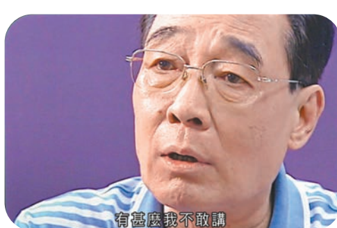
林尚義講波以生動有趣、有嘞句講嘞句見稱。